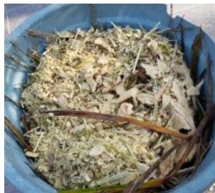
Gambar 3. Hasil Cacahan Pelepah Kelapa Sawit

Tabel 3 menunjukkan pengelompokan hasil cacahan pelepah kelapa sawit berdasarkan ukuran panjang hasil cacahan.