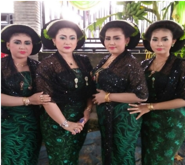
Gambar 3. Cantik bersahaja sesuai dengan nilai yang diidealkan masyarakat