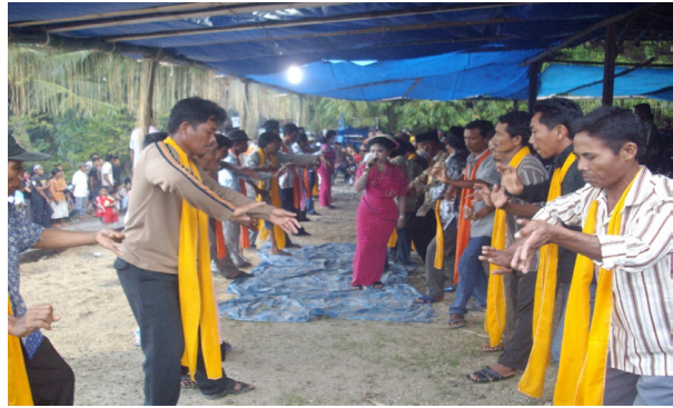
Gambar 2. Foto menggerakkan tubuh dengan perasaan khusuk menghayati permainan gêndhing

Estetika ke dua berakar dari Esensi tetayungan geguyuban ngudi guyub menyimpulkan makna berjalan dalam