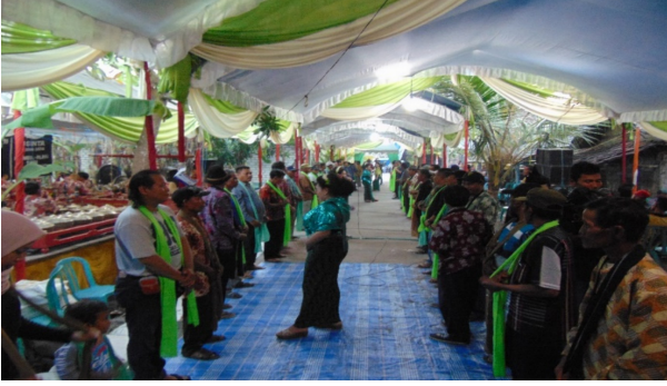
Gambar 1. Tertib sebagai cerminan ditata ben guyub

terkandung nilai-nilai yang relevan dengan budaya saat ini, nilai kebersamaan, persatuan, dan egalitarian (2017:98).