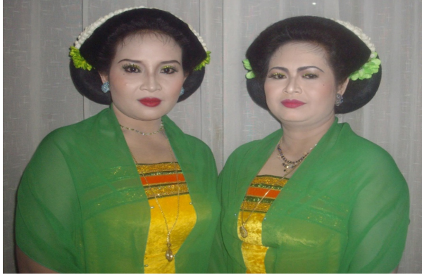
Gambar 4 pencitraan konsep sedhet sedhep

bagaimana busana dikenakan, ditata disesuaikan antara postur tubuh, ruang sosial, maupun ruang estetika tradisi pertunjukan. Singsêt rapêt melekat pada tubuh sesuai dengan nilai-nilai yang dihayati oleh masyarakat (Wawancara Yahya 12 Mei 2018). Singsêt rapêt merepresentasikan kerapian dalam mengenakan busana, harus “ pas kêngcêng, praktis kabéh kêtutup rapêt gak ting slawir ” (semua dikenakan dengan pas, kencang, praktis semua tertutup rapat). Didêlok ketok dêmênakaké ora kêtok saru risi, bokong sak tebok susuné sak gênthong-gênthong ya énak gak kêtok rusoh nglombrot ” dilihat tampak menyenangkan tidak seronok, dan risih, pantat yang besar, payudara yang besar tidak kelihatan kotor, seronok, dan kedodoran. Hal ini relevan dengan pernyataan Dwi Suryani bahwa mengenakan kostum yang indah menarik perhatian (2014: 105).