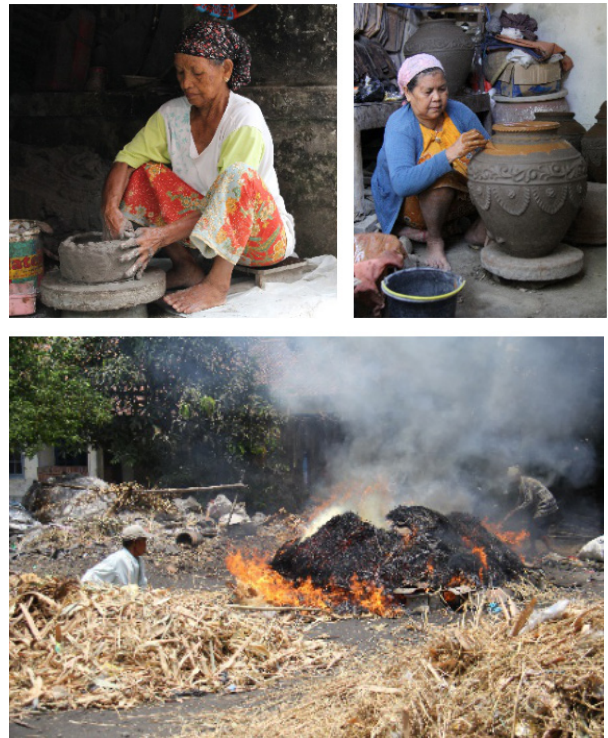
Gambar 5-7. Proses pembentukan, dekorasi dan pembakaran kerajinan keramik Sitiwinangun

Hal yang menarik pada sentra kerajinan keramik Sitiwinangun yaitu masih bertahannya pembuatan keramik tradisional dengan teknik pembentukan tatap pelandas ( paddle anville ) yang telah berkembang di Indonesia sejak masa prasejarah. Selain itu, dikembangkan juga teknik handbuilding dan teknik putar dengan menggunakan alat putaran tangan ( handwheel ). Kemudian teknik pembakaran yang digunakan masih menggunakan tungku ladang ( open firing ) secara tradisional yang sangat khas dengan durasi yang sangat cepat yakni hanya sekitar 45 menit dengan bahan bakar jerami, ranting, bambu, dan karet bekas yang sangat atraktif sehingga banyak menarik perhatian pengunjung yang datang ke sentra. Sementara dekorasi produknya banyak menggunakan teknik toreh dan tempel yang masih sederhana namun dibuat dengan keterampilan dan kepekaan estetik yang sangat tinggi (Gambar 5-7). Keterampilan dan artistik yang tinggi merupakan salah satu ciri khas dan kelebihan para perajin di Indonesia termasuk Sitiwinangun. Bangsa Indonesia dianugerahi banyak insan terampil yang punya bakat, kerajinan, ketekunan,