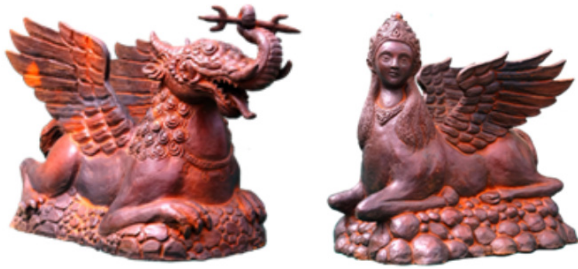
Gambar 22-23. Patung mitos Paksinagaliman dan Burok hasil pengembangan (karya seni). (Sumber: Deni Yana dan Gustiyan Rachmadi, 2019)