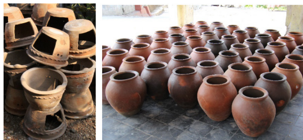
Gambar 8-9. Produk kerajinan keramik Sitiwinangun untuk fungsi pakai.

Selain memolo dan padasan ada juga beberapa produk pakai/fungsi yang sering digunakan dalam upacara ritual agama dan tradisi atau kepercayaan yang berkembang