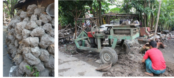
Gambar 3-4. Proses penyiapan bahan baku di sentra kerajinan Keramik Sitiwinangun

membuat keramik suhu rendah ( Earthenware ) depositnya masih cukup banyak yang dapat diperoleh oleh perajin Sitiwinangun dari area persawahan di sekitar sentra. Tanah liat tersebut kemudian dicampur pasir halus dari pinggir sungai agar struktur body -nya lebih kuat dan tidak mudah pecah baik dalam proses pembentukan, pengeringan, maupun pembakaran (Gambar 3-4). Permasalahannya adalah standar kualitas bahan baku yang masih rendah karena proses pengolahannya yang masih tradisional dengan teknologi dan peralatan yang masih sederhana. Dengan demikian tanah liat yang dihasilkannya masih kasar sehingga berpengaruh secara langsung terhadap prosentase kegagalan produksi dan rendahnya kualitas produk yang dihasilkan.