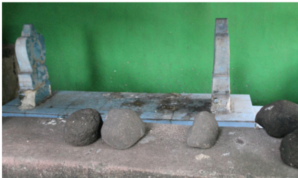
Gambar 1-2. Makam Ki Jaya Baya dan batu untuk ritual di Desa Sitiwinangun

membuat keramik suhu rendah ( Earthenware ) depositnya masih cukup banyak yang dapat diperoleh oleh perajin Sitiwinangun dari area persawahan di sekitar sentra. Tanah liat tersebut kemudian dicampur pasir halus dari pinggir sungai agar struktur body -nya lebih kuat dan tidak mudah pecah baik dalam proses pembentukan, pengeringan, maupun pembakaran (Gambar 3-4). Permasalahannya adalah standar kualitas bahan baku yang masih rendah karena proses pengolahannya yang masih tradisional dengan teknologi dan peralatan yang masih sederhana. Dengan demikian tanah liat yang dihasilkannya masih kasar sehingga berpengaruh secara langsung terhadap prosentase kegagalan produksi dan rendahnya kualitas produk yang dihasilkan.