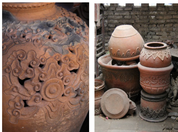
Gambar 15-16. Motif/ragam Megamendung dan Wadasan pada kerajinan keramik Sitiwinangun

Berdasarkan pembahasan tersebut, selain teknik pembakaran tungku ladang ( open firing ), memolo , padasan , patung mitos, dan motif Megamendung merupakan ciri khas utama sekaligus identitas keramik Sitiwinangun yang berbeda dengan keramik