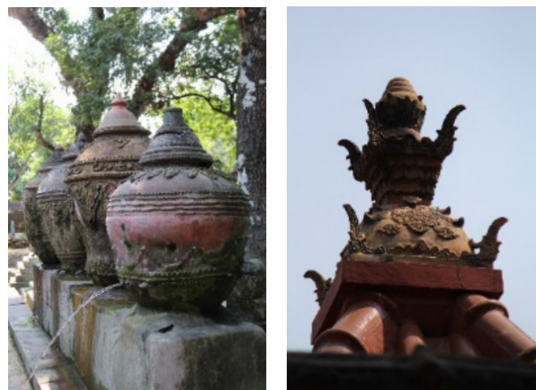
Gambar 10-11. Padasan dan Memolo

dalam masyarakat setempat seperti buyung , paso , kepingan keramik, cuwo dan kendi untuk upacara tujuh bulan kehamilan. Selain itu, pendil juga sering digunakan dalam upacara kelahiran sebagai tempat untuk menyimpan ari-ari bayi yang baru lahir. Buyung dan gentong selain fungsi pakai utamanya, juga sering digunakan sebagai wadah untuk menyimpan uang dari tamu undangan dalam upacara khitanan. Sementara dalam upacara pernikahan, selain kendi, hampir semua jenis keramik fungsional digunakan dalam upacara pernikahan selain juga sebagai bagian dari barang seserahan dari pihak mempelai pria. Selain dalam upacara kelahiran dan pernikahan, dalam upacara kematian pun kendi sering digunakan sebagai alat untuk menyiram air disamping padupaan untuk