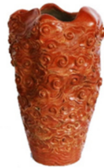
Gambar 26-28. Keramik Sitiwinangun hasil pengembangan berbasis motif Megamendung

Pengembangan berikutnya yaitu pemanfaatan motif hias Megamendung untuk menghasilkan keramik berupa karya seni dalam bentuk vas dan benda fungsi/pakai tableware dalam bentuk piring. Motif/ragam hias Megamendung beserta bentuk dasarnya dieksplorasi secara optimal menjadi kesatuan bentuk karya yang sangat unik dengan garis yang sangat dinamis dan estetis. Hasil eksplorasi tersebut menghasilkan produk keramik baru yang modern dengan konsep dan fungsi baru, dari produk fungsional untuk benda pakai menjadi karya seni untuk fungsi ekspresi dengan ikon, material, dan teknik (pembentukan, dekorasi, dan pembakaran) yang masih tradisional.