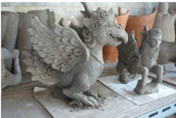
Gambar 17-18. Proses sketsa/desain dan aplikasi di sentra kerajinan keramik Sitiwinangun

sudah mengalami pergeseran hanya sebagai benda hias biasa dan banyak ditemukan dengan standar teknis dan estetis yang perlu ditingkatkan kualitasnya. Umumnya patung-patung yang ditemukan di sentra berukuran besar, bobotnya cukup berat, dan finishing -nya masih kasar dengan image yang cenderung mistis sehingga dalam penelitian ini dilakukan pengembangan dengan cara melakukan perubahan terhadap konsep, bentuk, dan fungsinya walaupun masih tetap menggunakan teknik, material dan ikon lama.