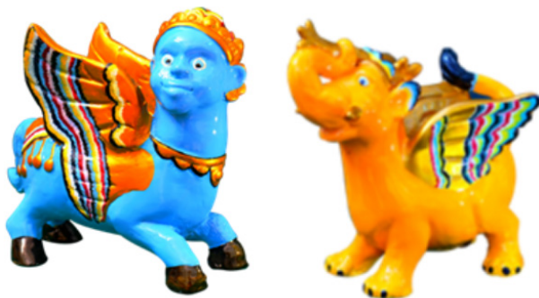
Gambar 24-25. Patung mitos Paksinagaliman dan Burok hasil pengembangan (keramik hias/souvenir).

sama tapi dengan tampilan bentuk, warna, dan karakter yang sangat berbeda. Secara bentuk lebih terkesan lucu, naif, dan menyenangkan. Adapun warna cat yang digunakan telah disesuaikan dengan trend forecasting 2019/2020 dengan tema Exuberant yang identik dengan bentuk yang jenaka dan warna-warna cerah yang dapat meningkatkan energi. Hal ini sangat berbeda dengan karakter warna dan finishing patung mitos Sitiwinangun sebelumnya yang masih natural dengan warna terakotanya. Jenis dan karakter warna yang paling disukai konsumen kerajinan keramik lokal di Indonesia pada umumnya berwarna cerah dengan permukaan yang mengilap. (Yana, 2014, hlm. 31).