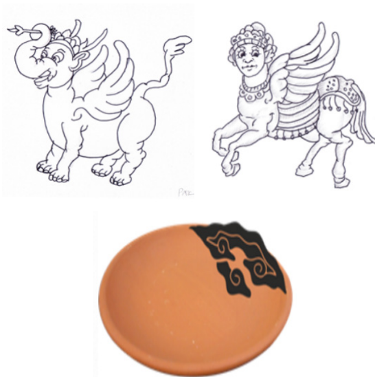
Gambar 19-21. Contoh desain/sketsa pengembangan patung mitos dan motif Megamendung.

Dengan ukuran yang lebih kecil, tipis, dan ringan, menjadikan produk atau karya keramik Sitiwinangun hasil pengembangan ini lebih sesuai dengan kebutuhan konsumen saat ini yang umumnya tinggal dengan ruang yang lebih terbatas. (Sriwardani, 2014,