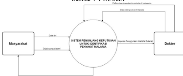
Gambar 2 Context Diagram

Sedangkan untuk spesifikasi tabel yang akan diimplementasikan ke dalam basis data disajikan pada Tabel 3-8.