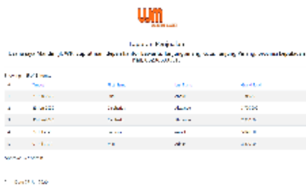
Gambar 9. Tampilan Output Laporan Penjualan

Untuk lebih jelas dapat dilihat pada Gambar 9 .