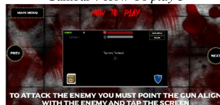
Gambar 8 How to play 4