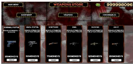
Gambar 14 Tampilan Shop Weapon