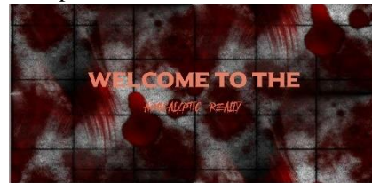
Gambar 3 Tampilan Welcome

Modul ini ditampilkan ketika health user di modul In game mencapai angka 0. Modul ini memiliki 3 button yaitu play , Shop , dan Main Menu . Setiap tombol yang berada di modul ini sudah dilakukan pengujian dan berjalan sesuai dengan perancangan game . Tampilan modul game Over dapat dilihat di Gambar 19 .