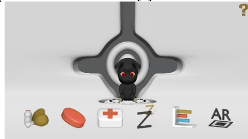
Gambar 1 game MoAR

melalui sudut pandang protagonis.[3] game ini menggunakan AR untuk memasukkan objek virtual 3D ke lingkungan dunia nyata dengan menggunakan Vuforia. Game ini berbasis Android dan tidak memerlukan jaringan untuk memainkan. Contoh game Augmented Reality yang sudah dibuat adalah game MoAR dan dapat dilihat di Gambar 1. [4]