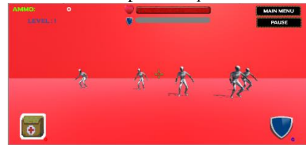
Gambar 17 Tampilan In game