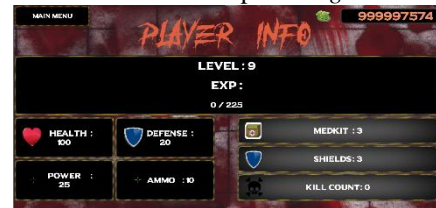
Gambar 18 Tampilan player Profile