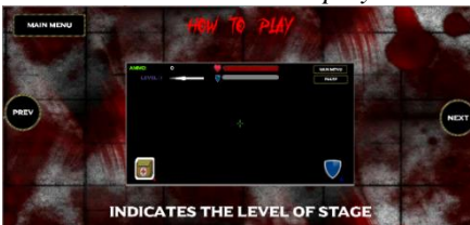
Gambar 12 How to play 8