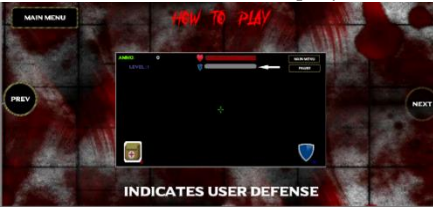
Gambar 13 How to play 10