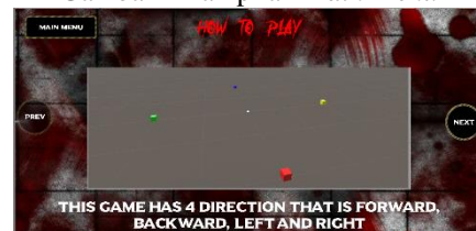
Gambar 5 How to play 1