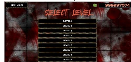
Gambar 21 Tampilan Select Level