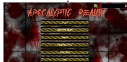
Gambar 4 Tampilan Main Menu