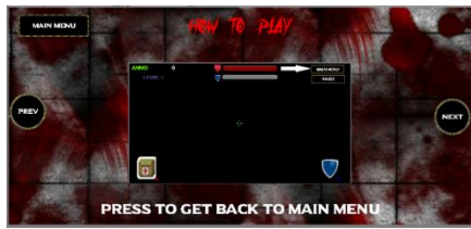
Gambar 9 How To play 5