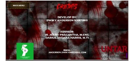
Gambar 20 Tampilan Credits