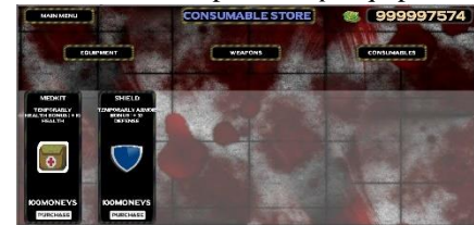
Gambar 16 Tampilan Shop Consumables