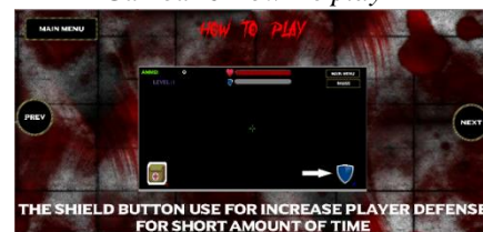
Gambar 7 How to play 3