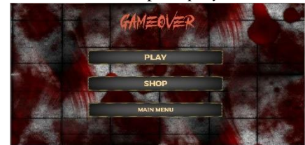
Gambar 19 Tampilan game Over