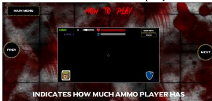
Gambar 11 How to play 7