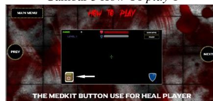
Gambar 6 How to play 2