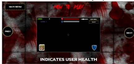
Gambar 12 How to play 9