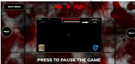
Gambar 10 How to play 6