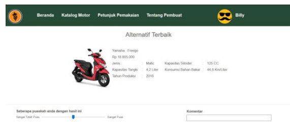
Gambar 3. Halaman Alternatif Terbaik

Tampilan output yaitu alternatif terbaik sepeda motor setelah memasukkan bobot kepentingan kriteria akan muncul pada halaman Alternatif Terbaik yang dapat dilihat pada Gambar 3 . Pada halaman ini ditampilkan alternatif terbaik sepeda motor hasil rekomendasi sesuai dengan pembobotan yang dilakukan oleh pengguna dan melalui proses perhitungan metode ELECTRE.