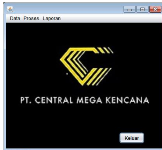
Gambar 4. Tampilan Menu Utama

Tampilan di atas merupakan rancangan tampilan Menu Utama. Tampilan Menu Utama menampilkan menu Penerimaan Karyawan Baru Pada PT Central Mega Kencana. Pada layar utama terdapat tiga menu bar, menu bar pertama yaitu menu bar “Data” yang di dalamnya terdapat dua menu item yaitu “Data Pelamar” digunakan untuk mengisi data calon karyawan yang melakukan lamaran pekerjaan, dan menu item “Data Pendidikan” digunakan untuk mengisi riwayat pendidikan calon karyawan yang melamar. Menu bar kedua yaitu menu bar “Proses” yang di dalamnya terdapat dua menu item yaitu “Jadwal Seleksi” digunakan untuk mengatur jadwal tes seleksi untuk bisa diterima sebagai karyawan, yang kedua menu “Hasil Seleksi” digunakan untuk mengetahui apakah calon karyawan memenuhi syarat atau tidak dalam mengisi tes yang sudah diberikan pihak PT Central Mega Kencana. Menu bar ketiga yaitu menu bar “Laporan” yang di dalamnya terdapat empat menu item yaitu “Laporan Data Pelamar” untuk menampilkan data pelamar yang telah melakukan pendaftaran dan akan mencetak data pelamar yang telah mendaftar, “Laporan Data Pendidikan” untuk menampilkan riwayat pendidikan calon pelamar dan akan mencetak data yang telah diisi, “Laporan Jadwal Tes Seleksi” untuk menampilkan jadwal tes yang harus dilaksanakan oleh para calon pelamar, yang terakhir “Laporan Hasil Tes” untuk menampilkan hasil tes yang telah dilaksanakan oleh calon pelamar, tombol “Keluar” digunakan untuk keluar dari tampilan menu utama.