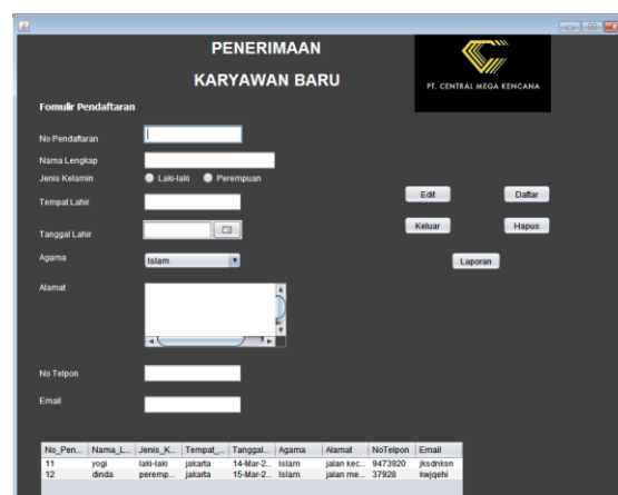
Gambar 5. Tampilan Data Calon Karyawan

Tampilan di atas merupakan rancangan tampilan Menu Utama. Tampilan Menu Utama menampilkan menu Penerimaan Karyawan Baru Pada PT Central Mega Kencana. Pada layar utama terdapat tiga menu bar, menu bar pertama yaitu menu bar “Data” yang di dalamnya terdapat dua menu item yaitu “Data Pelamar” digunakan untuk mengisi data calon karyawan yang melakukan lamaran pekerjaan, dan menu item “Data Pendidikan” digunakan untuk mengisi riwayat pendidikan calon karyawan yang melamar. Menu bar kedua yaitu menu bar “Proses” yang di dalamnya terdapat dua menu item yaitu “Jadwal Seleksi” digunakan untuk mengatur jadwal tes seleksi untuk bisa diterima sebagai karyawan, yang kedua menu “Hasil Seleksi” digunakan untuk mengetahui apakah calon karyawan memenuhi syarat atau tidak dalam mengisi tes yang sudah diberikan pihak PT Central Mega Kencana. Menu bar ketiga yaitu menu bar “Laporan” yang di dalamnya terdapat empat menu item yaitu “Laporan Data Pelamar” untuk menampilkan data pelamar yang telah melakukan pendaftaran dan akan mencetak data pelamar yang telah mendaftar, “Laporan Data Pendidikan” untuk menampilkan riwayat pendidikan calon pelamar dan akan mencetak data yang telah diisi, “Laporan Jadwal Tes Seleksi” untuk menampilkan jadwal tes yang harus dilaksanakan oleh para calon pelamar, yang terakhir “Laporan Hasil Tes” untuk menampilkan hasil tes yang telah dilaksanakan oleh calon pelamar, tombol “Keluar” digunakan untuk keluar dari tampilan menu utama.