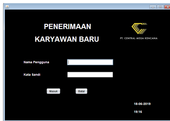
Gambar 3. Tampilan Login

Selanjutnya Peneliti membuat aplikasi menggunakan Java Netbeans dan database mysql. Berikut adalah tampilan dari aplikasi Penerimaan Karyawan Baru Pada PT Central Mega Kencana :