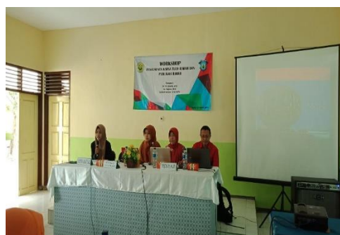
Gambar 2. Penyampaian Materi