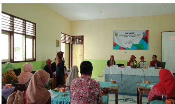
Gambar 3. Pembukaan Acara Oleh Wakasek