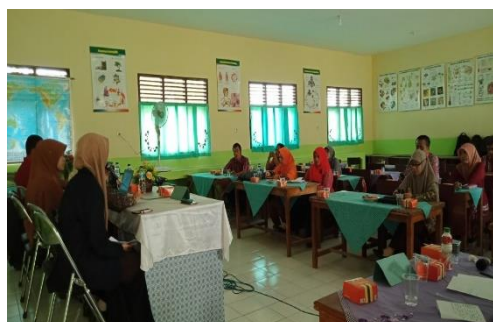
Gambar 7. Latihan Menyusun Laporan PTK