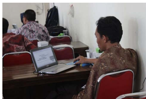
Gambar 8. Latihan menyusun Artikel

Berbagai metode digunakan dalam pelaksanaan pelatihan perancangan penelitian tindakan kelas, yaitu ceramah, diskusi, dan praktik. Metode ceramah dan diskusi digunakan untuk menjelaskan materi mengenai kemampuan menyusun penelitian tindakan kelas dalam pembelajaran dan cara menyusun laporan penelitian tindakan kelas oleh guru dilakukan di Aula SMAN Panarukan Situbondo. Metode praktik diperlukan guna untuk mengetahui seberapa jauh guru mampu merancang penelitian tindakan kelas dan menyusun laporan penelitian kelas.