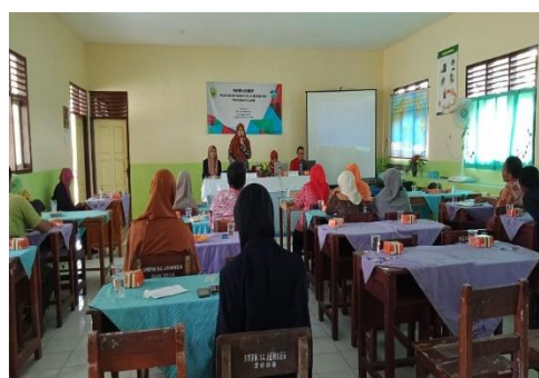
Gambar 4. Penyampaian Materi