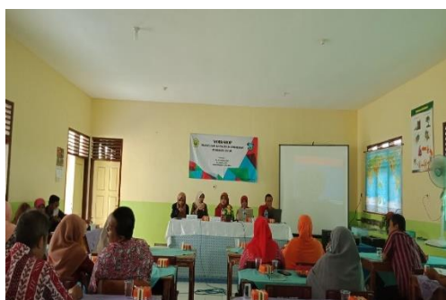
Gambar 1. Pembukaan

Prosedur kerja untuk mendukung metode pelaksanaan yang ditawarkan sebagai bentuk pelaksanaan program pengabdian kepada masyarakat meliputi: penyusunan perencanaan (planning), pelaksanaan (action), pengamatan (observation) dan refleksi (reflection), dan sistematika penelitian tindakan kelas, melakukan praktik mengembangkan dan menyusun penelitian tindakan kelas, dan diakhir dengan kegiatan evaluasi.