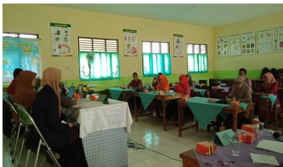
Gambar 5. Penyampaian Materi