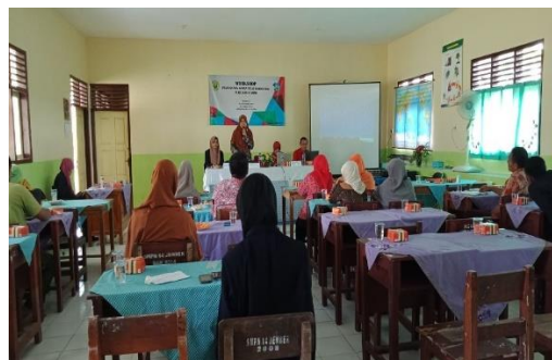
Gambar 6. Penyampaian Materi