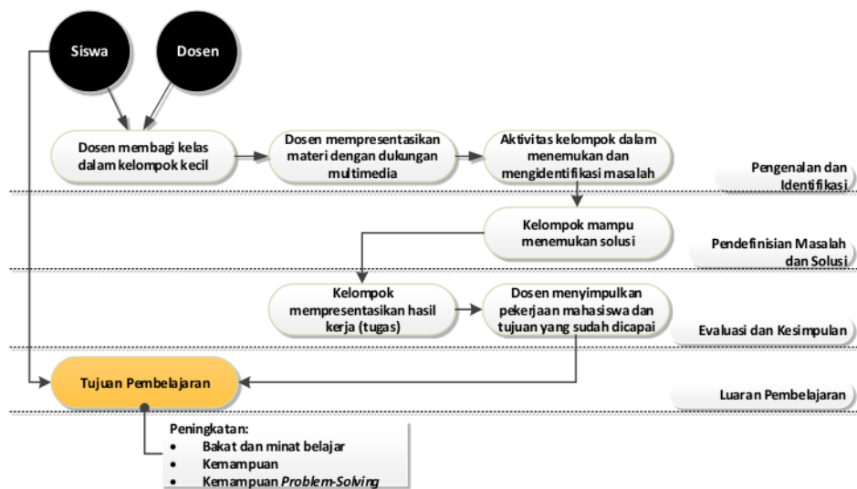
Gambar 2: Tahapan pendekatan pembelajaran mDPBL

Penjelasan yang berkaitan dengan detail tahapan dan aktifitas pada kerangka pendekatan pembelajaran mDPBL adalah sebagai berikut: