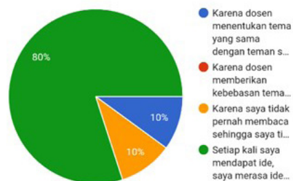
Gambar 3: Kesulitan dalam Memunculkan Ide

Hal apa yang membuat kamu merasa sulit dalam memunculkan ide? 10 tanggapan