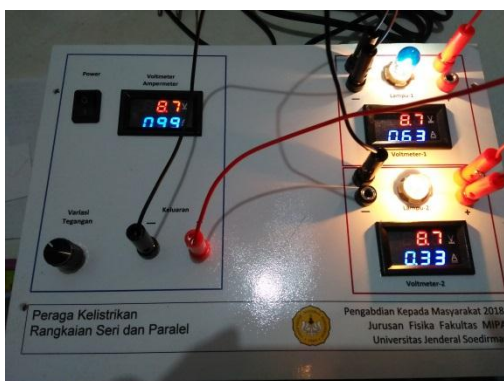
Gambar 2. Alat peraga kelistrikan

Paket alat peraga kelistrikan terdiri dari satu daya DC variabel, tiga buah voltmeter, tiga buah ampermeter, dua buah fitting lampu, beberapa lampu dengan daya berbeda dan kabel penghubung. Voltmeter dan ampermeter digunakan sebagai alat ukur untuk menunjukkan nilai tegangan dan arus pada rangkaian. Susunan lampu dan alat ukur dapat diatur sehingga membentuk rangkaian seri atau paralel. Peragaan menggunakan alat ini dapat dilakukan untuk rangkaian seri maupun paralel. Para siswa dapat langsung dilibatkan untuk merealisasikan gambar rangkaian seri atau paralel dalam paket alat peraga listrik. Para siswa dapat langsung mengamati nilai tegangan dan arus listrik yang ditunjukkan pada display alat peraga. Para siswa dapat membuktikan sifat dari rangkaian seri maupun paralel. Paket alat peraga yang sudah berhasil dibuat ditunjukkan pada Gambar 2.