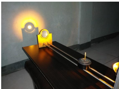
Gambar 1. Alat peraga optik

lensa yang tersedia. Para siswa dapat mengamati langsung sifat pembiasan dan melihat bayangan yang terbentuk. Paket alat peraga optik seperti ditunjukkan pada Gambar 1.