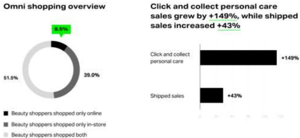
Gambar 1. Persentase Pembelanjaan Produk Kecantikan dan Pertumbuhan Penjualan melalui Online dan Perorangan

demikian analisis mengenai produk kosmetik dalam hal ini masker, keunggulan dan analisis komparatifnya merupakan kajian yang menarik terutama pada masa pandemi seperti sekarang ini.