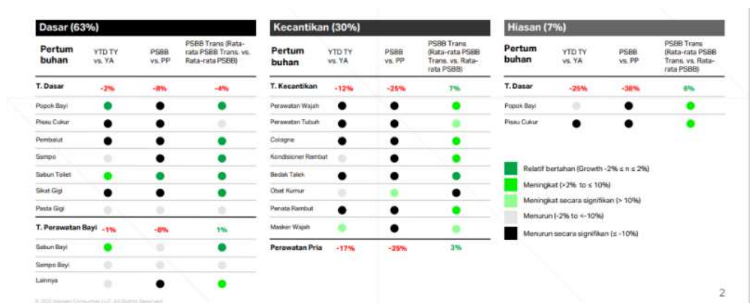
Gambar 2. Tingkat Pemulihan pada Produk Dasar, Produk Kecantikan dan Produk Riasan pada Masa Awal Pandemi dan New Normal Baru

Masker merupakan salah satu produk perawatan kecantikan yang mengalami kenaikan atau memiliki tren positif. Masker yang merupakan produk perawatan wajah pada mengalami penurunan tajam pada April - Mei 2020 (pada saat awal pandemi) dan telah pulih setelah Juni. Pergerakan positif ini dikaitkan dengan dimulainya kembali aktivitas normal di bawah protokol kesehatan yang direkomendasikan. Pertumbuhan pemulihan diamati sejak Juni pasca penetapan PSBB yang lebih ketat (pertengahan Maret - pertengahan Mei). Namun, meski sudah pulih, kategori Perawatan Pribadi secara keseluruhan belum kembali ke tingkat normal. Hal ini disajikan pada Gambar 2.