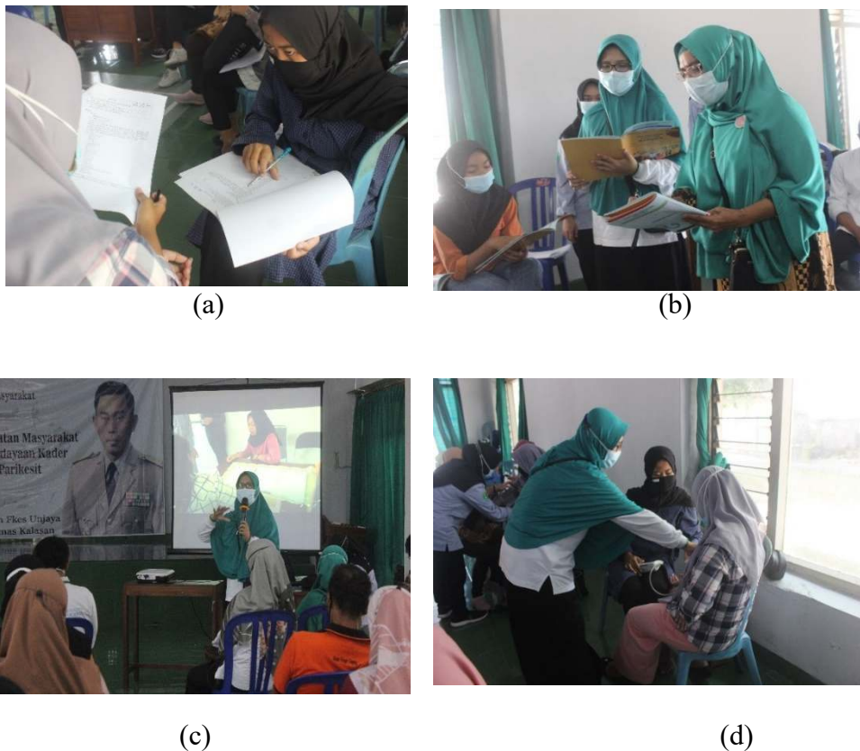
Gambar 2. Pretest (a), Edukasi tentang hipertensi (b) (c), Evaluasi redemonstrasi pengukuran tekanan (d)

Posyandu remaja parikesit merupakan bentuk Upaya Kesehatan Bersumberdaya Masyarakat (UKBM) yang salah satu kegiatannya adalah pengendalian penyakit tidak menular. Pada pelatihan kader, pengabdian dan tim tidak menemukan kendala yang berarti karena mayoritas kader memiliki motivasi dan antusiasme yang tinggi untuk mengikuti pelatihan dari awal hingga akhir dalam rangka meningkatkan pengetahuan dan keterampilan mereka untuk mencegah penyakit tidak menular. Usia kader yang tergolong muda dan pengakuan terhadap keberadaan mereka di masyarakat menjadi kekuatan untuk keberlanjutan kegiatan ini.