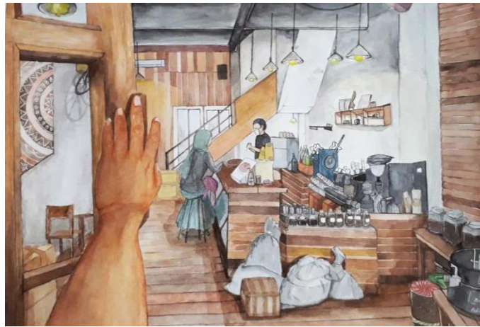
Gambar 12. Welcome to Coffee Shop 40 cm x 60cm/ Media watercolour (2020)

Dalam segi visualisasi karya, penulis menggarap karya dalam bentuk sudut pandang seorang konsumen yang datang ke coffee shop dengan menggambarkan tangan konsumen yang sedang membuka pintu kedai. Didepannya terdapat pemandangan bartender , barista , dan juga konsumen lain yang sedang bersantai disana. Tidak lupa pencahayaan yang bagus turut menciptakan suasana yang damai. Warna coklat mendominasi pada karya ini, mulai dari lantai, meja bartender , serta sebagian dinding. Sehingga suasana yang antik terlihat pada karya ini. Tidak lupa peralatan coffee shop untuk menunjang kebutuhan barista untuk menciptakan minuman yang berkualitas.