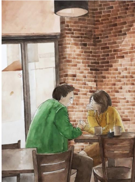
Gambar 21. Little Memories 40 cm x 60cm/ Media watercolour (2020)

Untuk karya yang terakhir, penulis mengangkat tema romantis setelah karya sebelumnya telah membahas tentang diri, pertemanan, konsumen, hingga metafora dalam hidup social. Karya dengan judul “ Little Memories ” menceritakan tentang sepasang kekasih yang menggunakan quality time mereka berada di salah satu coffee shop . Penulis menciptakan suasana romantis dengan pencampuran warna kalsik dan hangat. Tidak terlalu tegas tetapi tidak juga terlalu lunak, serta objek di luar yang sengaja dibuat buram agar tidak merusak suasana di dalam café.