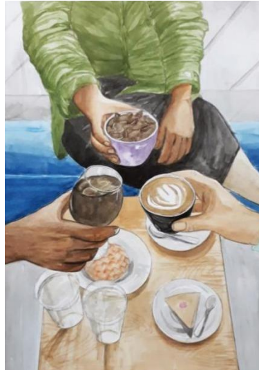
Gambar 19. Bullshit Roasting 40 cm x 60cm/ Media watercolour (2020)

Pada karya kedelapan, penulis membuat karya sedikit lebih menarik karna penulis mencoba mengintrepertasikan ilustrasi kopi dalam bentuk metafora. Dalam visualisasi ilustrasi terdapat 3 wadah yaitu dua gelas cangkir dan satu gelas wine, yaitu isian biji kopi dengan wadah cangkir kopi, kopi hitam pada gelas wine, dan cappuccino dengan latte art pada cangkir kopi. Dipegang oleh tiga orang berbeda dan tidak lupa objek pendukung pada meja seperti gelas dan makanan pendamping.