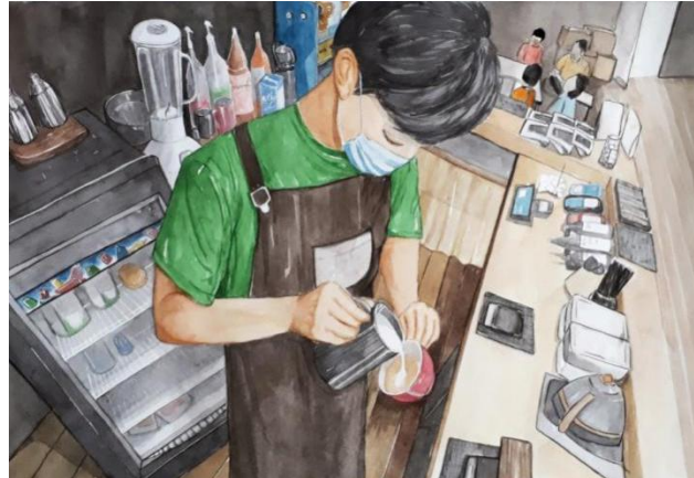
Gambar 17. Barista and Their World 40 cm x 60cm/ Media watercolour (2020)

Visualisasi karya keenam adalah karya yang menarik bagi penulis, karena selama membuat sketsa ilustrasi yang langsung dikerjakan di venue , penulis banyak mendapatkan informasi dari hasil tanya jawab yang sangat berguna untuk laporan kali ini. Karya keenam dengan judul “ Barista and Their World ” bercerita tentang kehidupan yang dijalani seorang barista atau koki coffee shop selama bekerja dilingkar meja bartender.