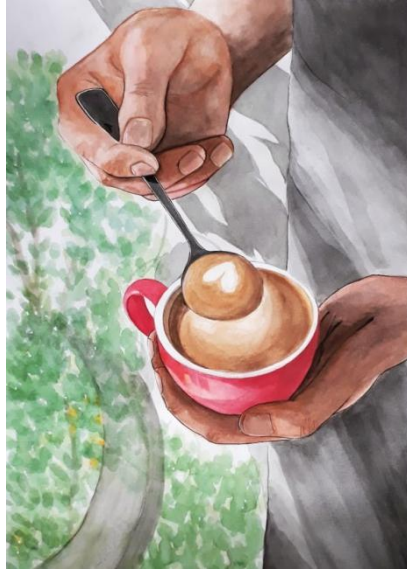
Gambar 15. Be Like Coffee 40 cm x 60cm/ Media watercolour (2020)

Pada karya ilustrasi yang berjudul Be Like Coffee ini tidak menampilkan suasana, namun salah satu ilustrasi dimana kopi bukanlah sebuah kata tanpa makna, karena dibalik kesederhanaan secangkir kopi dan seduhannya telah menghadirkan banyak sekali cerita. Bahkan tak jarang muncul ide berkat secangkir kopi yang salah satunya adalah novel yang diadaptasikan menjadi sebuah film yang berjudul “Filosofi Kopi”.