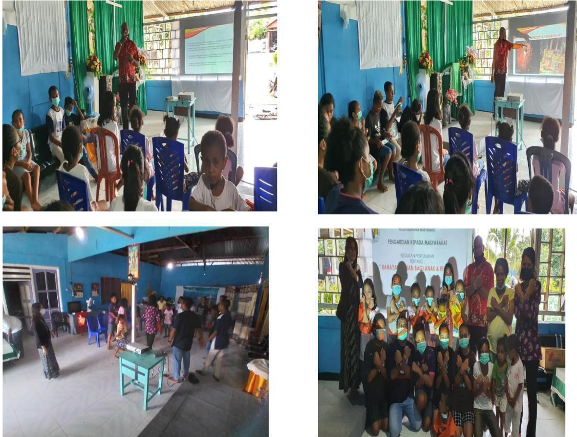
Gambar 1. Kegiatan Penyuluhan Bahaya Petasan