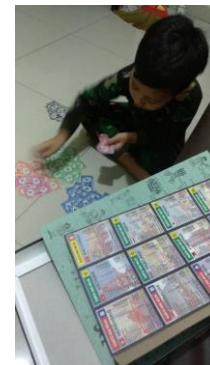
Gambar 9. Foto pengembangan gim oleh orang tua dan anak di rumah