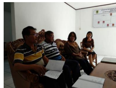
Gambar 2. Penerjunan di Kantor Desa Taji Prambanan

Pada tanggal 19 Maret 2020 pelaksanaan kegiatan penyuluhan pengabdian masyarakat untuk TK Kristen mulai dilaksanakan. Kegiatan ini diawali dengan penerjunan Tim Dosen Penyuluhan oleh Tim LPPM kepada Kepala Desa Taji dan TK Kristen Tunas Kasih. Proses penerjunan dilakukan untuk menjalin silaturahmi dan ijin ke Kepala Desa Taji Prambanan jika ada kegiatan berupa penyuluhan dari Institut Seni Indonesia Yogyakarta di TK Kristen Tunas Kasih.