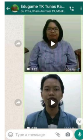
Gambar 8. WAG untuk Diskusi orang tua, guru dan tim penyuluh

orang tua kebingungan untuk memberikan kegiatan anak yang menyenangkan, namun tetap ada unsur edukasi.