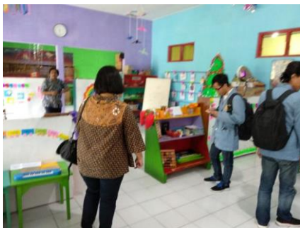
Gambar 4. Kegiatan Diskusi bersama Guru TK Tunas Kasih

Guru-guru diajak untuk berdiskusi dari perosotan tadi dan diperoleh sebuah alur permainan. Saat anak mau naik perosotan, masing-masing akan diminta mencontohkan untuk bagaimana caranya minta ijin, mencontohkan cara mencuci tangan yang benar, dan mencontohkan kegiatan lainnya yang akan membiasakan anak untuk melakukan kegiatan yang sudah diajarkan sebelumnya.