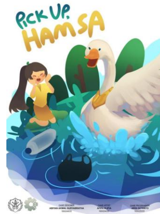
Gambar 5. Game Pick Up. Hamsa

Hamsa. Game Pick Up Hamsa memberikan edukasi dalam membentuk karakter anak seperti Hamsa yang menyukai kebersihan. Dalam permainan ini, Hamsa akan membersihkan sampah-sampah yang ditemukan dalam perjalanannya menyelamatkan Dewi Saraswati. Game Pick Up Hamsa [4], menjadi contoh bentuk pengembangan kreatifitas yaitu permainan yang dimulai dari sebuah cerita atau karakter sebuah tokoh yang kemudian dibawa menjadi desain sebuah permainan.