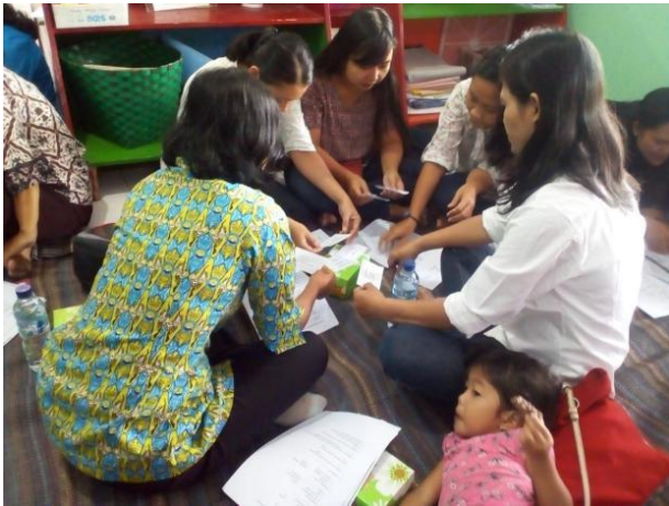
Gambar 7. Suasana Diskusi Orang Tua Siswa

diberikan misalnya setelah bangun pagi apa yang harus dilakukan? Jawaban yang diharapkan adalah anak akan melakukan berdoa, merapikan tempat tidur kemudian mandi. Jika hal ini berulang-ulang dilakukan, maka bisa memberikan pemahaman dan menjadi pengetahuan untuk anak.