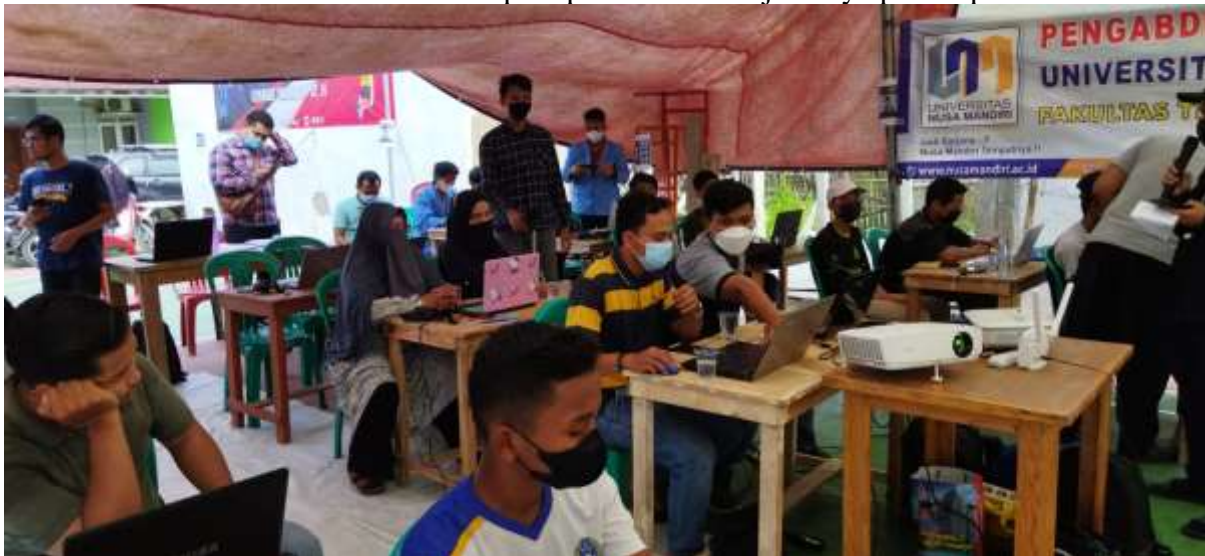
Gambar 2. Dokumentasi

Pada saat berjalannya pelatihan dalam pengabdian masyarakat ini, mitra pengabdian masyarakat berkontribusi baik dengan para pengajar dengan cara mengikuti pelatihan dengan aktif. Berikut adalah dokumentasi dari para peserta saat berjalannya proses pelatihan: