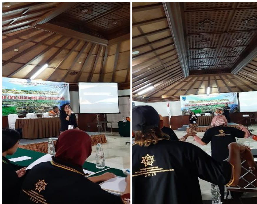
Gambar 1. Foto kegiatan

Kegiatan pelatihan ini tidak berakhir sampai di sini, melainkan tim pemateri masih melanjutkan dengan kegiatan pendampingan yang tujuannya adalah mendampingi masyarakat di Kelurahan Kauman Kidul untuk mengimplementasikan apa yang sudah diperoleh melalui kegiatan pelatihan dalam perencanaan pariwisata.