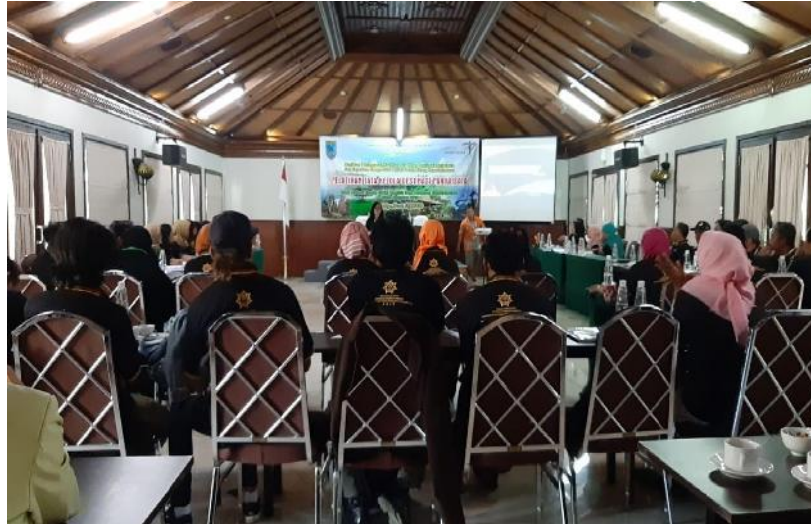
Gambar 2. Foto kegiatan