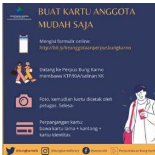
Gambar 3. Tata cara pembuatan kartu anggota secara online

Inovasi layanan selanjutnya adalah sistem pendaftaran anggota secara online . Pemustaka yang ingin menjadi anggota Perpustakaan Proklamator Bung Karno Blitar dapat mendaftar keanggotaan secara online dengan cara mengisi formulir online . Formulir tersebut dapat diakses melalui link berikut http://bit.ly/keanggotaanperpusbungkarno . Apabila semua data sudah diisi, pemustaka kemudian datang ke perpustakaan membawa KTP/KIA/Salinan KK serta untuk pengambilan foto dan cetak kartu anggota. Kartu anggota yang sudah jadi dapat langsung dimanfaatkan oleh pemustaka untuk meminjam koleksi perpustakaan.