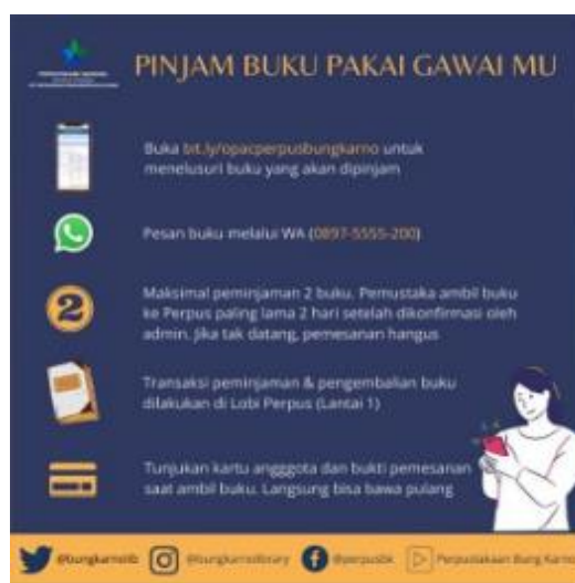
Gambar 1. Infografis tentang tata cara peminjaman buku secara online