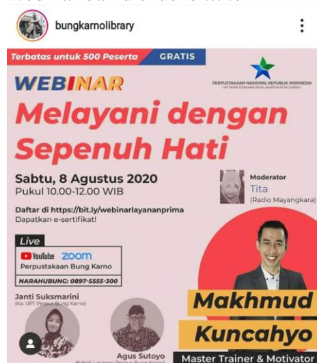
Gambar 8. Informasi kegiatan Webinar di akun Instagram @bungkarnolibrary

Kegiatan ini merupakan inovasi layanan lain yang dilakukan oleh UPT Perpustakaan Proklamator Bung Karno Blitar selama pandemi Covid-19. Awalnya dilaksanakan pada bulan Ramadan dengan nama ROLASAN (Ngobrolin Indonesia saat Ramadan). Namun kegiatan tersebut terus berlanjut hingga setelah Ramadan. Konsep kegiatan ini menghadirkan narasumber dan peserta kegiatan secara online melalui berbagai aplikasi seperti Instagram (@bungkarnolibrary), Youtube (channel : Perpustakaan Bung Karno), dan Zoom secara langsung ( live ).