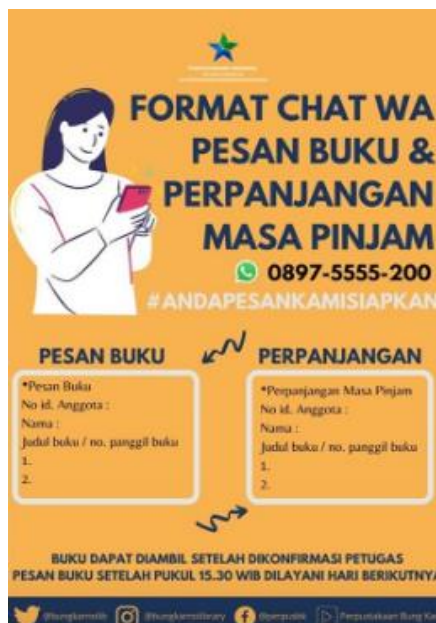
Gambar 2. Format peminjaman dan perpanjangan buku secara online

Layanan SOLASI merupakan singkatan dari layanan sistem online anda pesan kami siapkan. Pemustaka dapat melakukan peminjaman buku, pemesanan buku, perpanjangan buku melalui gawai mereka melalui layanan SOLASI. Namun, koleksi yang dapat dipinjam masih terbatas pada koleksi umum. Koleksi anak sementara waktu masih belum bisa dipinjamkan. Sedangkan koleksi khusus Bung Karno, koleksi referensi, dan koleksi berkala untuk dibaca di tempat.