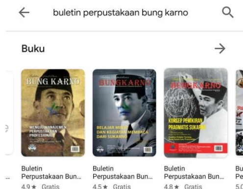
Gambar 6. E-book Buletin UPT Perpustakaan Proklamator Bung Karno Blitar

UPT Perpustakaan Proklamator Bung Karno Blitar menyediakan koleksi e-book (buku elektronik) untuk pemustakanya. Koleksi e-book pada UPT Perpustakaan Proklamator Bung Karno terdiri dari beberapa jenis, termasuk di dalamnya adalah e-book koleksi khusus Bung Karno, pidato Bung Karno, bibliografi beranotasi Bung Karno serta buletin. Koleksi e-book UPT Perpustakaan Proklamator Bung Karno Blitar dapat diakses pada situs web UPT Perpustakaan Proklamator Bung Karno Blitar dengan link sebagai berikut https://perpusbungkarno.perpusnas.go.id/index.php/koleksi/koleksi-ebook .