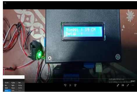
Gambar 2. Pengujian Produk

menguji beberapa fungsi yang salah atau hilang, desain, kesalahan performa dan lain sebagainya.