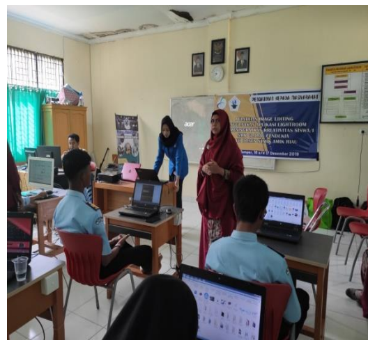
Gambar 4. Dokumentasi Pemberian materi Video Editing

SMK Global Cendekia sangat antusias menerima materi dikarenakan belum pernah belajar tentang video editing menggunakan Adobe premiere. Siswa/i merasa tertantang dengan ilmu yang baru mereka dapat dan memiliki keinginan untuk lebih memperdalam mengenai video editing tersebut. Dibawah ini Gambar 4. merupakan dokumentasi saat pemberian materi video editing .