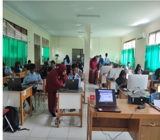
Gambar 7. Dokumentasi Pemberian praktikum Video Editing dengan menggunakan Adobe Premier