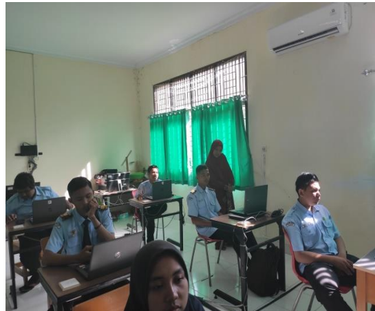
Gambar 8. Dokumentasi Pemberian praktikum Image Editing dengan menggunakan Lightroom