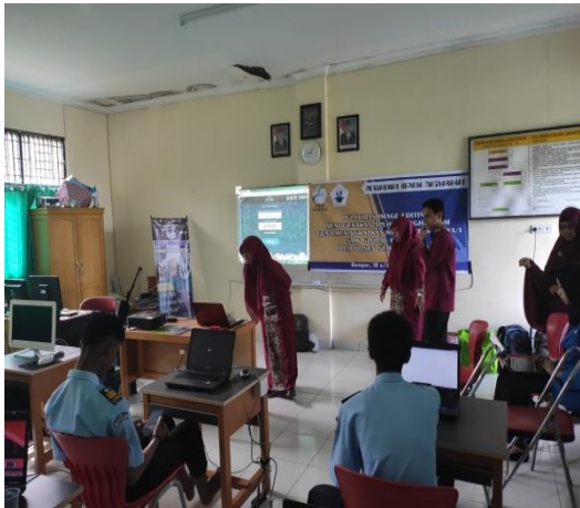
Gambar 2. Dokumentasi Pemberian Pretest Image Editing dan Video Editing