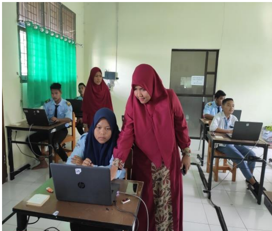
Gambar 6. Dokumentasi Pemberian praktikum Image Editing dengan menggunakan Lightroom

Kegiatan pelatihan yang dilaksanakan di SMK Gelobal Cendekia ini telah dilakukan dengan hasil yang baik. Siswa siswi telah diberi materi tentang image dan video editing serta praktikum menggunakan Lightroom dan Adobe Premiere sehingga siswa siswi menguasai materi yang disampaikan dengan sangat baik. Dibawah ini Gambar 6. Sampai Gambar 10 merupakan dokumentasi pelaksanaan praktikum image dan video editing .