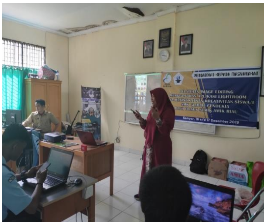
Gambar 3. Dokumentasi Pemberian materi image editing

Pada kegiatan ini, siswa/i SMK Global Cendekia sangat antusias menerima materi dikarenakan belum pernah belajar tentang image editing menggunakan Lightroom. Siswa/i merasa tertantang dengan ilmu yang baru mereka dapat dan memiliki keinginan untuk lebih memperdalam mengenai image editing tersebut. Dibawah ini Gambar 3. merupakan dokumentasi saat pemberian materi image editing .