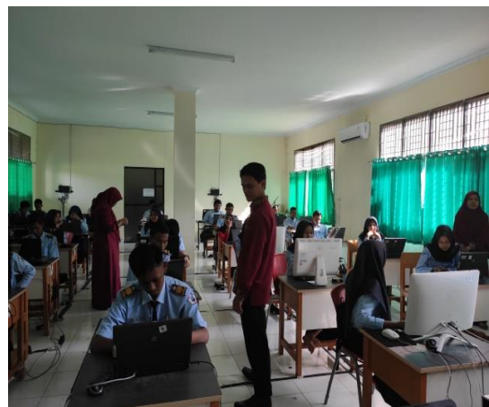
Gambar 9. Dokumentasi Pemberian praktikum Image Editing dengan menggunakan Lightroom