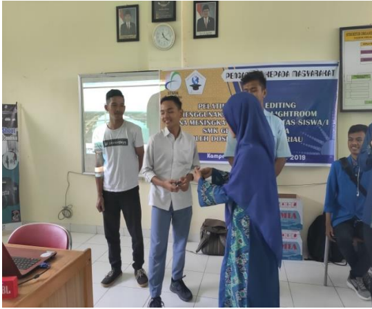
Gambar 5. Dokumentasi Pemberian Posttest Image Editing dan Video Editing

Kegiatan pelatihan yang dilaksanakan di SMK Gelobal Cendekia ini telah dilakukan dengan hasil yang baik. Siswa siswi telah diberi materi tentang image dan video editing serta praktikum menggunakan Lightroom dan Adobe Premiere sehingga siswa siswi menguasai materi yang disampaikan dengan sangat baik. Dibawah ini Gambar 6. Sampai Gambar 10 merupakan dokumentasi pelaksanaan praktikum image dan video editing .