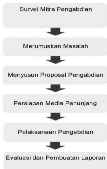
Gambar 1. Tahapan Pelaksanaan Pengabdian Masyarakat

Dalam melaksanakan kegiatan Pengabdian Masyarakat dilakukan beberapa tahapan yang dapat dilihat pada Gambar 1 berikut ini: