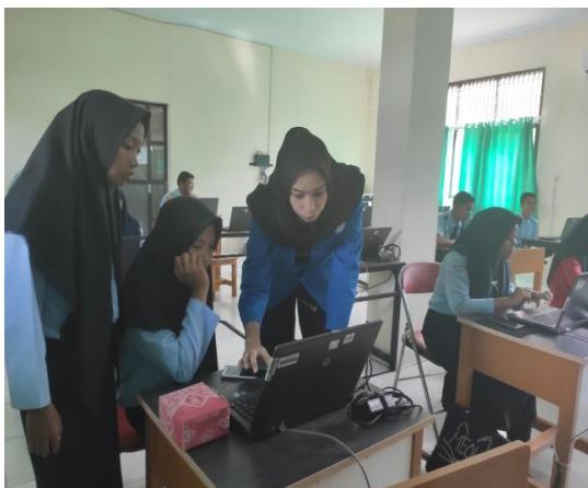
Gambar 10. Dokumentasi pelaksanaan Praktikum Image dan Video Editing

Setelah pelaksanaan pemberian materi dan praktikum mengenai image dan video editing siswa siswi dapat disimpulkan bahwa siswa siswi mengalami peningkatan dalam pengetahuan mengenai image dan video editing . Hal ini dapat dilihat dari siswa siswi dapat mengikuti materi dan menjawab pertanyaan kuis serta mereka dapat melaksanakan praktikum secara baik. Dibawah ini merupakan Gambar 11. grafik perbandingan hasil nilai post test dan pre test yang dilakukan terhadap siswa/i peserta pelatihan image dan video editing .