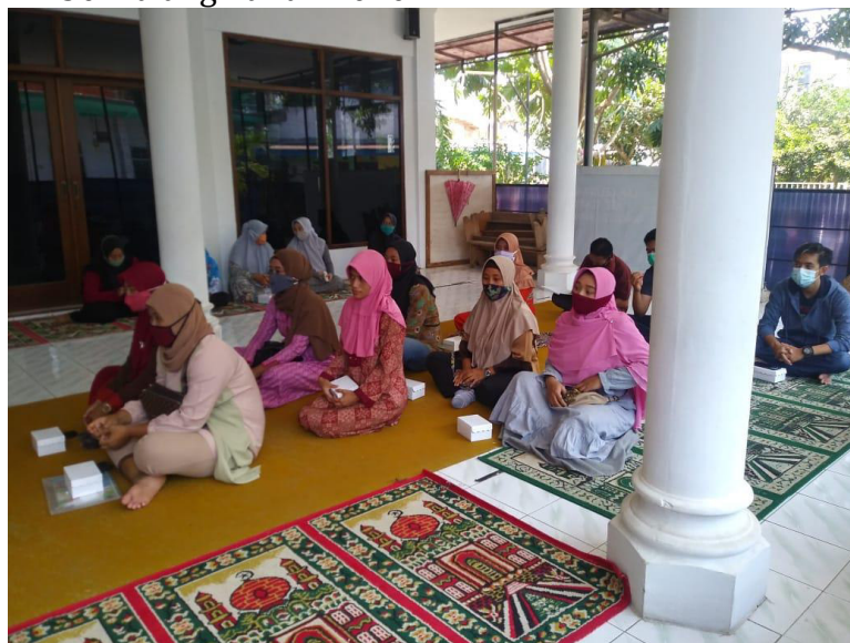
Gambar 2. Proses pemberian materi

Pengabdian ini juga melakukan pemberian materi tentang tumbuh kembang psikososial dan bagaimana cara melakukan deteksi dini tumbuh kembang psikososial pada anak pra-