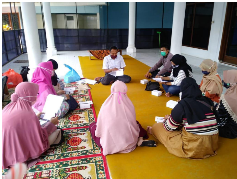
Gambar 3. Proses diskusi dan melakukan pretest dan post test

Berdasarkan pada gambar 1 didapatkan hasil bahwa rata-rata pengetahuan orang tua murid TK ABA 30 Malang adalah cukup. Hal ini disebabkan, beberapa murid diasuh oleh nenek atau kakeknya. Maka, saat orang tua hadir sebagai peserta, mereka yang tidak ikut langsung mengasuh anaknya, sebagian merasa kesulitan memahami perkembangan psikososial anaknya. Tetapi, karena peserta tetap patuh mengikuti pelatihan hingga akhir, studi kasus dan demonstrasi yang dilakukan oleh tim, maka pada post test hasilnya menunjukkan bahwa terjadi banyak peningkatan. Hal ini bisa dikarenakan orang tua murid rata-rata memiliki tingkat pendidikan jenjang sarjana (S1).