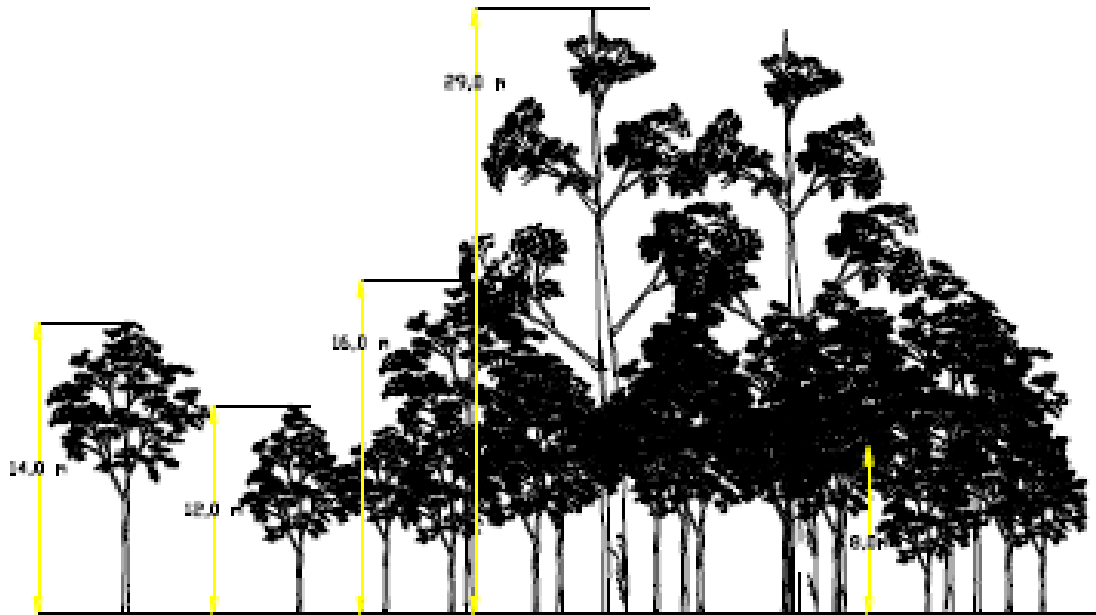
Gambar 2. Struktur Tegakan Vertikal (Diagram Profil) di Danau Tanjung Putus

Dari Gambar 2, struktur tegakan vertikal di danau Tanjung Putus secara keseluruhan dapat ditemukan stratum tertinggi adalah stratum B dengan pohon tertinggi adalah Gluta renghas dengan tinggi sekitar 29 m. Hal ini sangat terkait dengan hasil pengukuran faktor fisika kimia yang didapat pada lokasi penelitian. Keanekaragaman vegetasi yang ada sangat menentukan ketersediaan unsur hara yang ada pada kawasan hutan wisata ini.