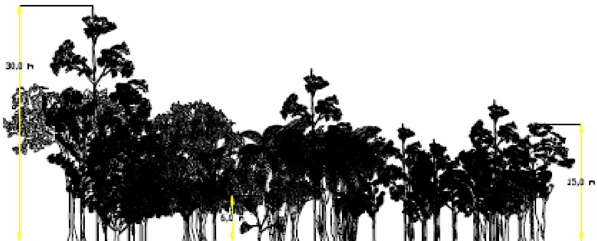
Gambar 3. Struktur Tegakan Vertikal (Diagram Profil) di Danau Pinang Luar

dengan suku Anonaceae terdiri dari 1 pohon, suku Dilleniaceae terdiri dari 6 pohon, suku Malvaceae terdiri dari 10 pohon, suku Anacardiceae terdiri dari 12 pohon, suku Sapindaceae terdiri dari 2 pohon, suku Moraceae terdiri dari 2 pohon, suku Sterculiaceae 2 pohon dan suku Dipterocarpaceae yang terdiri dari 2 pohon.