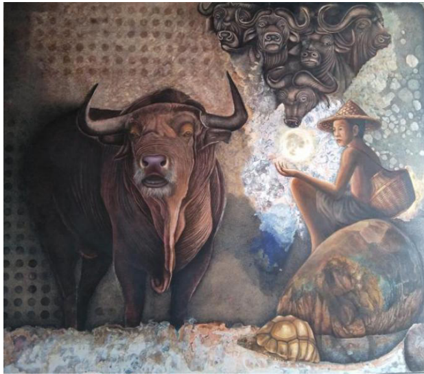
Karya 4. Lestari Bumiku , 2020, pen, cat akrilik, cat minyak pada kanvas, 160 x 140 cm.