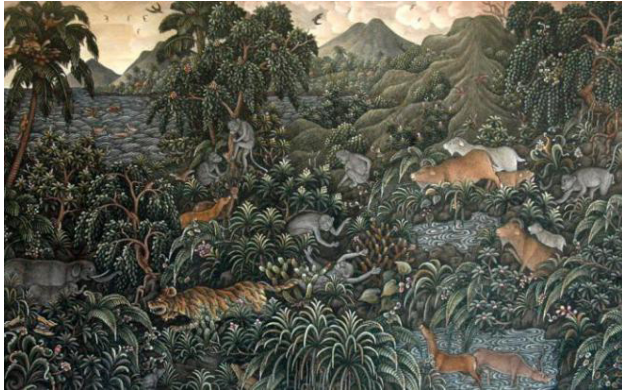
Gambar 1. I Wayan Taweng, 2016, Harmoni , 51 x 33 cm, akrilik pada kertas (Sumber: koleksi Titian Gallery, Ubud).