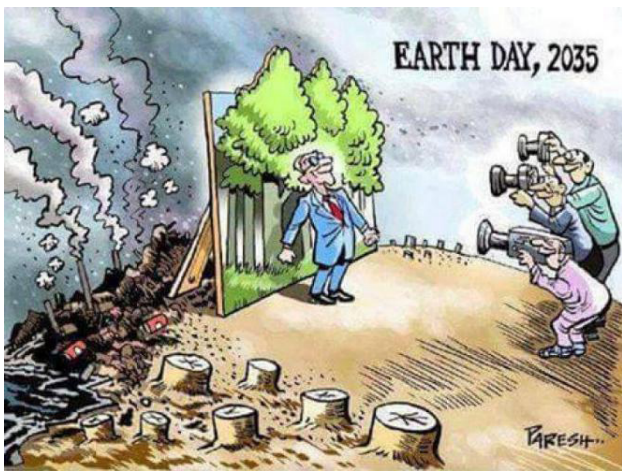
Gambar 2. Paresh, 2019, Earth Day 2035 , 30 x 30 cm, pen dan akrilik pada kertas.

manusia pada alam diatur sedemikian rupa agar terjaga suatu keharmonisan yang diyakini bakal menghasilkan situasi stabil bagi alam serta kemakmuran bagi manusia. Seni lukis tradisi gaya Ubud, gaya Batuan sampai seni lukis modern dan kontemporer banyak para senimannya mendasari kreativitas ketika berkarya berlandaskan pemikiran tentang kesinambungan ekosistem.