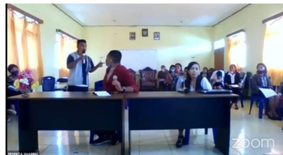
Gambar 4. Sesi Tanya-Jawab

Mahasiswa yang terlibat dalam kegiatan ini sebanyak 109 orang yang berasal dari lima program studi yang sedang mengambil program mata kuliah skripsi di STKIP Citra Bakti pada tahun akademik 2020/2021 yakni 27 mahasiswa program studi PGSD, 10 mahasiswa program studi PJKR, 52 mahasiswa program studi PG-PAUD, 10 mahasiswa program studi pendidikan musik dan 10 mahasiswa program studi pendidikan matematika.