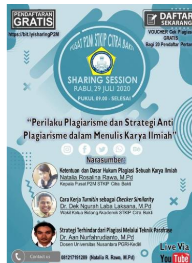
Gambar 2. Brosur Kegiatan

Berdasarkan hasil identifikasi awal ditetapkan rancangan kegiatan pengabdian kepada masyarakat dengan metode penyuluhan dalam bentuk sharing session semi online . Selanjutnya menentukan tema atau topik kegiatan, menentukan narasumber kegiatan, menentukan jadwal pelaksanaan kegiatan, mendesain brosur kegiatan, menyebarkan brosur melalui fanspage facebook STKIP Citra Bakti dan WhatsApp Group program studi. Mahasiswa yang akan mengikuti kegiatan ini mendaftar pada link registrasi yang telah disediakan dalam brosur.