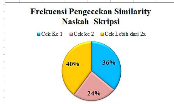
Gambar 6. Persentase Frekuensi Pengecekan Similarity

Tindak lanjut dari kegiatan pengabdian ini adalah menganalisis tingkat plagiarisme karya ilmiah mahasiswa berupa naskah skripsi sebagai prasyarat sidang skripsi di STKIP Citra Bakti. Mahasiswa wajib melakukan cek similarity terhadap naskah skripsi sebelum melanjutkan ke tahap sidang skripsi menggunakan turnitin checker yang difasilitasi oleh unit Pusat Penelitian dan Pengabdian kepada Masyarakat (P2M) STKIP Citra Bakti. Toleransi kemiripan sebesar < 30%. Turnitin dikenal sebagai salah satu perangkat ( tools ) pendeteksi kemiripan naskah karya ilmiah baik berupa makalah, skripsi, tesis, disertasi, buku dan lain sebagainya.