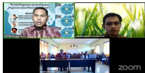
Gambar 3. Penyajian Materi oleh Narasumber

mahasiswa yang lokasi tempat tinggalnya masih dalam radius terdekat dengan lokasi kampus dapat mengikuti kegiatan di dalam lingkungan kampus dengan tetap mengikuti protokol kesehatan, sedangkan beberapa mahasiswa lainnya yang berasal dari luar kabupaten dapat mengikuti secara online dari rumah masing-masing. Meski kegiatan ini dilaksanakan secara semi online , tidak ada perbedaan perlakuan antara mahasiswa yang mengikuti kegiatan di kampus dengan mahasiswa yang mengikuti kegiatan dari rumah secara online . Semua mahasiswa diberikan kesempatan yang sama untuk bertanya hal-hal yang belum dipahami selama pelaksanaan sesi tanya-jawab.