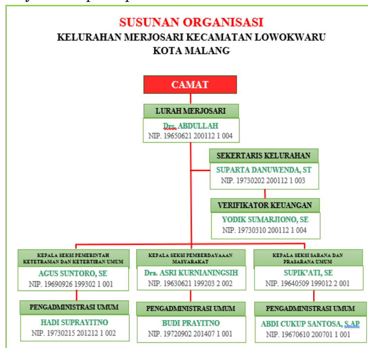
Gambar 3. Struktur Organisasi Kelurahan Merjosari (“Susunan Organisasi Perangkat Kelurahan Merjosari Tahun 2019,” 2019)

Kelurahan Merjosari sebagai salah satu kelurahan yang ada di Kota Malang memiliki struktur organisasi kerja yang mendukung terselenggaranya pemerintahan di wilayahnya. Struktur organisasi pada Kelurahan Merjosari seperti pada Gambar 3 berikut.