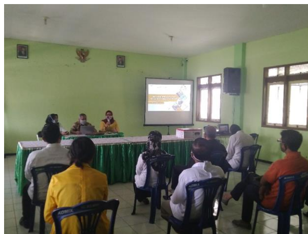
Gambar 2. Dokumentasi Kegiatan Sosialisasi

Untuk memecahkan masalah yang terjadi pada pemerintahan kelurahan Merjosari, metode yang tepat untuk digunakan dalam pengabdian ini adalah pendidikan dan pelatihan atau pendampingan. Pendidikan dilakukan dengan pemberian materi dan sosialisasi paparan mengenai Undang-undang Keterbukaan Informasi Tahun 2008, Peraturan Komisi Informasi Nomor 1 Tahun 2018 (Peraturan Komisi Informasi Nomor 1 Tahun 2018 tentang Standar Layanan Informasi Publik Desa, 2018), dan peran Kelurahan sebagai ujung tombak pelayanan daerah dalam mewujudkan keterbukaan informasi public seperti pada Gambar 2 berikut.