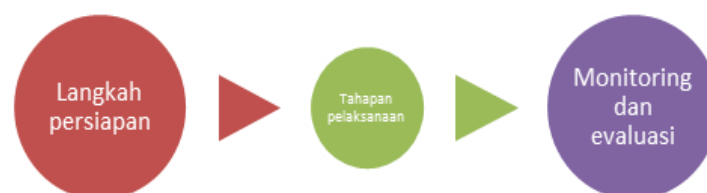
Gambar 1. Langkah Kegiatan

Langkah pelaksanaan kegiatan pendampingan ini meliputi tahapan persiapan, pelaksanaan pendampingan pemberantasan huruf al Quran melalui metode Iqra, serta monitoring dan evaluasi yang disajikan pada Gambar 1 berikut.