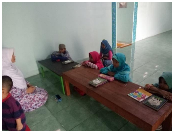
Gambar 2. Proses Pendampingan Pemberantasan Buta Huruf al-Quran

Pendampingan pemberantasan huruf al Quran dilakukan dengan pembinaan secara langsung pada anak yang disertai praktik. Anak dan tim pelaksana mengajari anak dalam mengenalkan huruf-huruf hijaiyah satu persatu. Proses pendampingan dengan memberitahu anak huruf-huruf hijaiyah secara keseluruhan, kemudian anak mulai belajar menggunakan Iqra 1. Anak membaca Iqra dan tim pelaksana mendengarkan dan membenarkan bila ada yang kurang tepat dalam satu halaman. Apabila dalam satu halaman telah mengetahui huruf secara pasti maka dapat melanjutkan pada halaman setelahnya. Proses pendampingan pemberantasan buta huruf al-Quran berlangsung seperti pada Gambar 2 berikut.