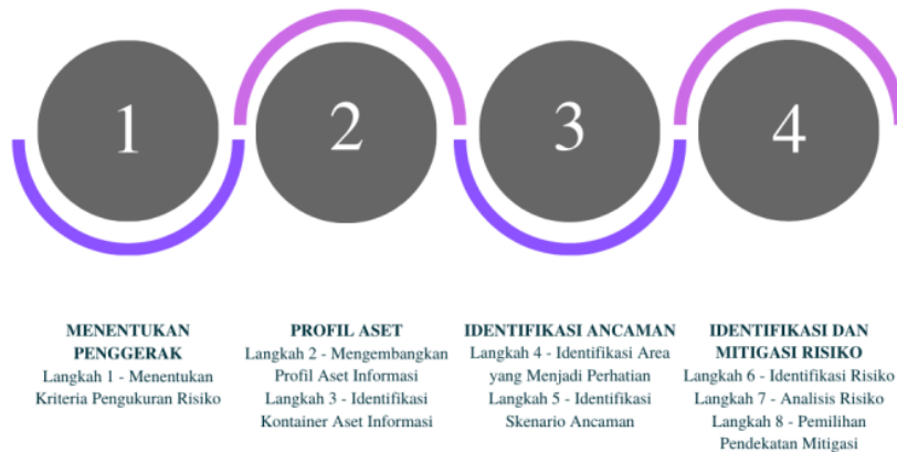
Gambar 1. Langkah-Langkah Metode OCTAVE Allegro.

Metode OCTAVE Allegro terdiri dari 8 langkah yang dikelompokkan menjadi empat fase[6]. Fase pertama adalah menentukan penggerak. Dalam fase ini terdapat satu langkah, yaitu menentukan kriteria pengukuran risiko. Penulis membuat kriteria pengukuran risiko berdasarkan hasil wawancara dengan tujuan sebagai acuan dalam penilaian risiko. Setelah mengetahui kriteria pengukuran risiko, lalu prioritas area dampak ditentukan. Kategori yang berdampak besar diberi nilai tertinggi dan yang tidak terlalu berdampak diberi nilai rendah.