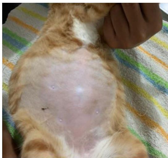
Gambar 1. Distensi Abdominal pada Kucing Minmin

Keterangan: H = high (meningkat); N = normal (Plumb, 2008)