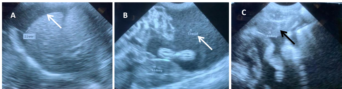
Gambar 3. Hasil pemeriksaan ultrasonografi menunjukkan terjadi penumpulan pada ujung hati (tanda panah putih) (A), adanya akumulasi cairan (citra anechoic ) pada rongga abdomen (tanpa panah putih) (B), dan terjadi penebalan pada korteks renalis ditandai dengan perubahan echotexture menjadi lebih echogenic (tanda panah hitam) (C) (dok. Pribadi, 2021).