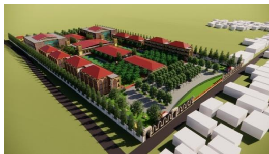
Gambar 1. Hasil Rancangan Tata Massa Bangunan SMAIT Kota Gorontalo

berbentuk barisan dengan bidang bangunan yang lebih besar menghadap ke arah timur dan barat.