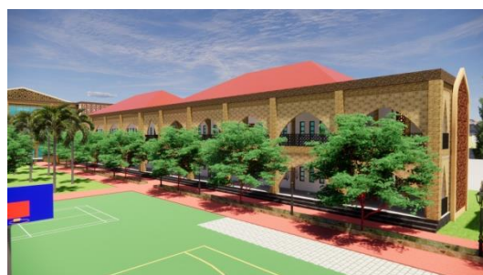
Gambar 3. Hasil Rancangan Eksterior Gedung Perpustakaan dan Laboratorium