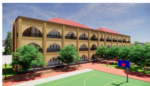
Gambar 2. Hasil Rancangan Eksterior Gedung Sekolah

Bentuk bangunan ruang luar pada SMAIT Kota Gorontalo didominasi dengan fasad yang dihiasi lengkungan-lengkungan dengan penggunaan warna yang tidak mencolok. Bahan yang menutupi lengkungan yaitu berasal dari keramik outdoor dengan motif batu alam timbul. Sedangkan pada permukaan kolom dan balok menggunakan relief bata ekspos dengan bahan GRC Relief, bahan ini menyelimuti seluruh struktur kolom dan balok yang terlihat.