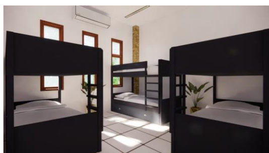
Gambar 6. Hasil Rancangan Interior Kamar Tidur Asrama