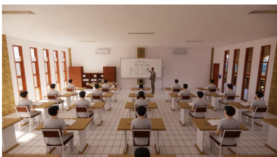
Gambar 5. Hasil Rancangan Interior Ruang Kelas

Bentuk bangunan ruang dalam SMAIT Kota Gorontalo didominasi dengan warna putih sebagai warna netral, juga didominasi bukaan jendela daripada dinding masif dengan tipe jendela double glass, sehingga ruang dalam mendapatkan sinar matahari yang cukup dengan meminimalisir hawa panas matahari yang akan masuk.