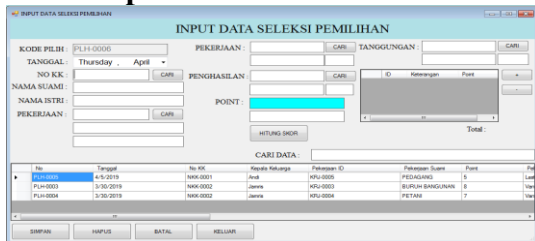
Gambar 7 Menu Input Data Pemilihan