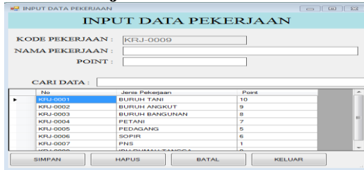
Gambar 4 Menu Input Data Pekerjaan