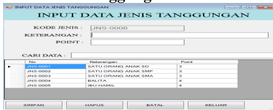
Gambar 6 Menu Data Jenis Tanggungan