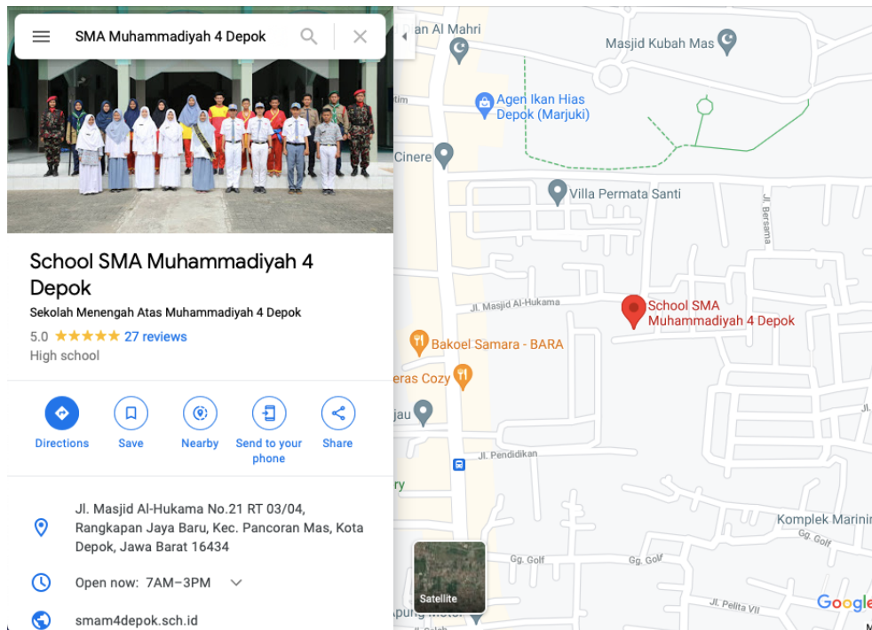
Gambar 1. Peta Lokasi PT Zurida Suganiya Utama

Oleh karena itulah bentuk pelatihan Microsoft Excel sebagai peningkatan keterampilan hard skill siswa SPT Zurida Suganiya Utama yang akan dilaksanakan nantinya menjadi solusi tepat. Pada era digitalisasi kreatifitas anak menjadi sangat penting, karena itu perlu pembekalan program komputasi seperti Microsoft Office salah satunya Microsoft Excel . Microsoft Excel diberbagai kebutuhan sering digunakan seperti menyusun laporan keuangan (Fajrinshanty, dkk, 2019), pelatihan dalam pengelolaan data dan penyusunan laporan keuangan (Mulyani, dkk, 2019) (Arsi, dkk, 2019), penerapan ilmu statistik di SMA seperti penginputan data ke tabel (Sihombing & Rahmawati, 2019), pelatihan atau traning oleh lembaga kursus (Azhar, dkk, 2019), dan masih banyak hal lain yang bisa dilakukan Microsoft Excel .