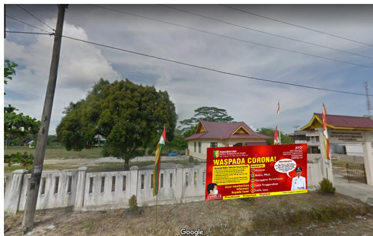
Gambar 6. Ilustrasi pemilihan lokasi pemasangan spanduk di pagar kantor

Selanjutnya, media spanduk dipasang di lokasi yang berdekatan dengan perkantoran, pasar, atau tempat umum lainnya yang memiliki pagar. Spanduk sesuai untuk dipasang di area yang memiliki pagar agar media tersebut mudah dikaitkan dan tahan terhadap terpaan angin.