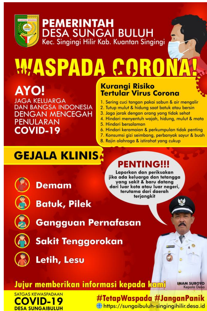
Gambar 3. Desain pracetak baliho untuk kampanye pencegahan Covid-19

Output kegiatan berupa hasil karya desain media luar ruang untuk kampanye pencegahan Covid-19 berbentuk baliho dan spanduk. Untuk desain baliho, ukurannya 2x3 meter dan desain spanduk 1,5x2,5 meter. Desain tersebut dicetak menggunakan teknik digital printing .