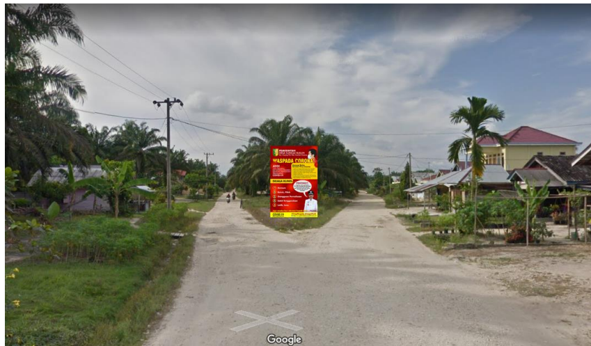
Gambar 5. Ilustrasi pemilihan lokasi pemasangan baliho di persimpangan jalan

Perencanaan penempatan media baliho dan spanduk menggunakan bantuan Google Maps agar hasilnya lebih realistis. Pemilihan lokasi pemasangan baliho yaitu di titik-titik persimpangan jalan, seperti perempatan dan pertigaan dengan tujuan agar media tersebut mudah dilihat oleh pengguna jalan. Hal ini sesuai dengan karakteristik media baliho yang umumnya dipasang di tempat umum terutama yang memiliki arus lalu lintas ramai.