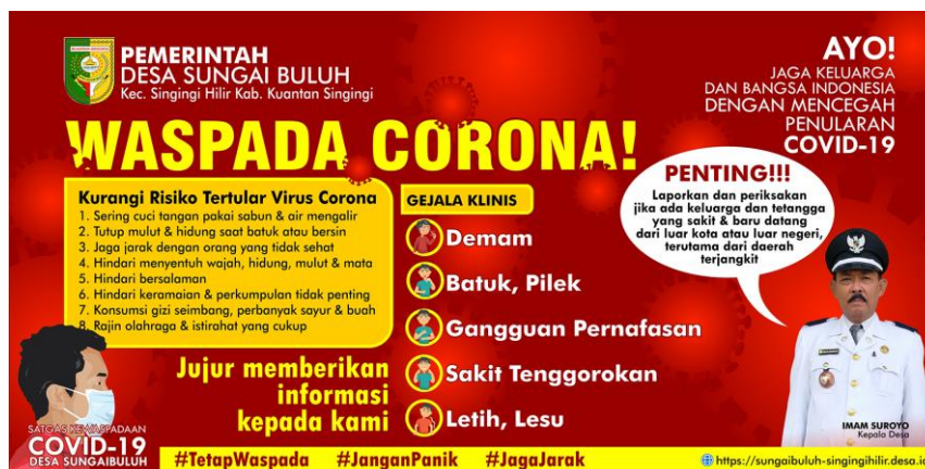
Gambar 4. Desain pracetak spanduk untuk kampanye pencegahan Covid-19