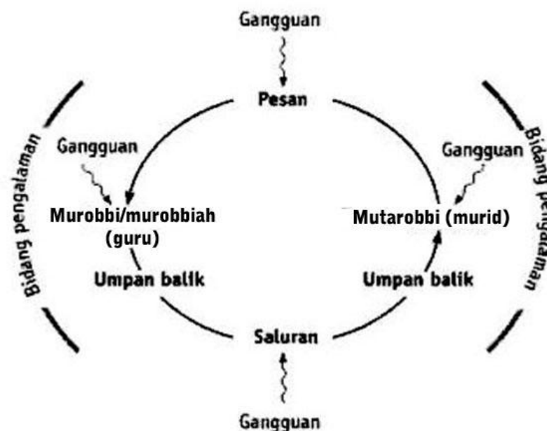
Gambar 1. Model Interaksional.

Melalui model interaksional tersebut dapat dikatakan bahwa murobbi/murobbiah dan mutarobbi memiliki kedudukan yang sederajat (homofili) atau sama pada saat sedang berkomunikasi antarpribadi. Mereka tidak memandang adanya atribut apapun, misalnya tingkat pendidikan, tingkat pemahaman agama Islam, perbedaan usia, jenis kelamin, atau tingkat sosial sehingga komunikasi yang dilakukan dapat berjalan lebih baik dan efektif. Dalam mempertahankan ekuilibrium , sistem dan subsistem harus melakukan transaksi yang tepat dengan lingkungannya (medan). Selain itu dalam model interaksional manusia dianggap lebih aktif. Menurut model interaksional para pesertanya adalah orang-orang yang mengembangkan potensi manusiawinya melalui interaksi sosial. Model ini menempatkan sumber dan penerima yang memiliki kedudukan yang sederajat. Satu elemen yang penting bagi model interaksional adalah umpan balik ( feedback ) atau tanggapan terhadap suatu pesan.