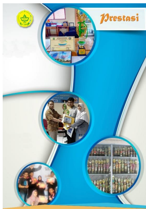
Gambar 15. Halaman 14