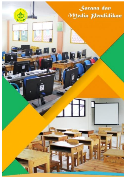
Gambar 8. Halaman 7

Desain dari Sarana dan Media Pendidikan ini berisi Foto sarana dan media pendidikan. Desain ini berwarna hijau dan kuning, font yang digunakan yaitu Calibri, Magneto