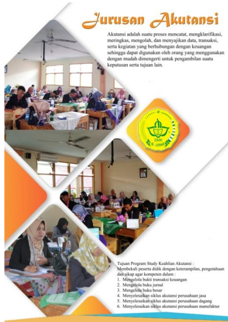
Gambar 12. Halaman 11

Jurusan Akutansi. Desain ini berwarna Hijau dan Kuning, font yang digunakan yaitu Calibri , Magneto