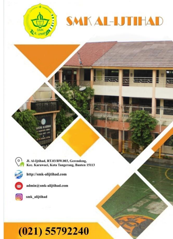
Gambar 18. Halaman 17

Desain dari Cover Belakang ini berisi foto-foto gedung sekolah. Desain ini berwarna putih, font yang digunakan yaitu Calibri, Magneto