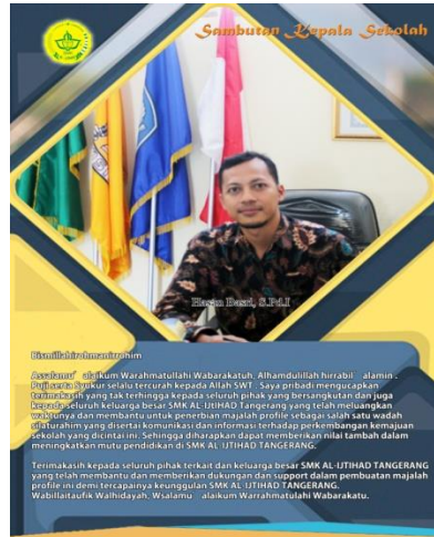
Gambar 4. Halaman 3

Desain dari Sambutan Kepala Sekolah ini berisi Foto Guru, dan Kata Sambutan Text-Text sambutan kepala sekolah. Desain ini berwarna kuning, font yang digunakan yaitu Calibri , Magneto