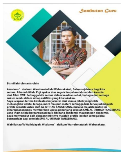
Gambar 5. Halaman 4