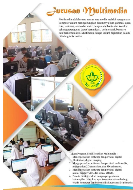
Gambar 11. Halaman 10