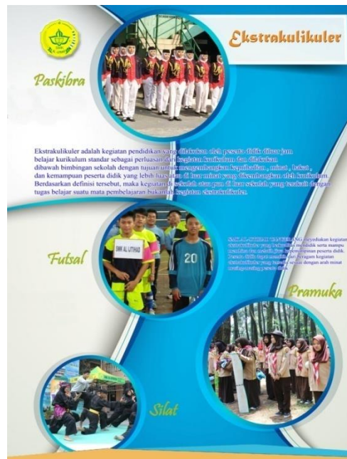
Gambar 14. Halaman 13

Desain dari Kegiatan ekstrakurikuler ini berisi Foto-Foto Kegiatan ekstrakurikuler. warna Biru dan Putih, font Calibri , Magneto