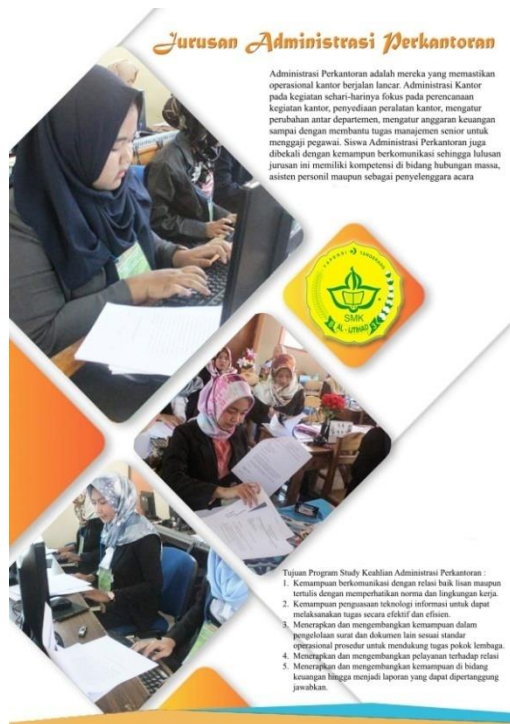
Gambar 13. Halaman 12