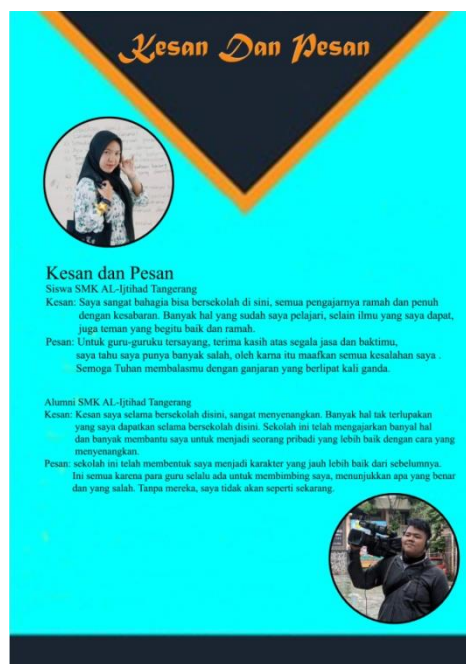
Gambar 17. Halaman 16