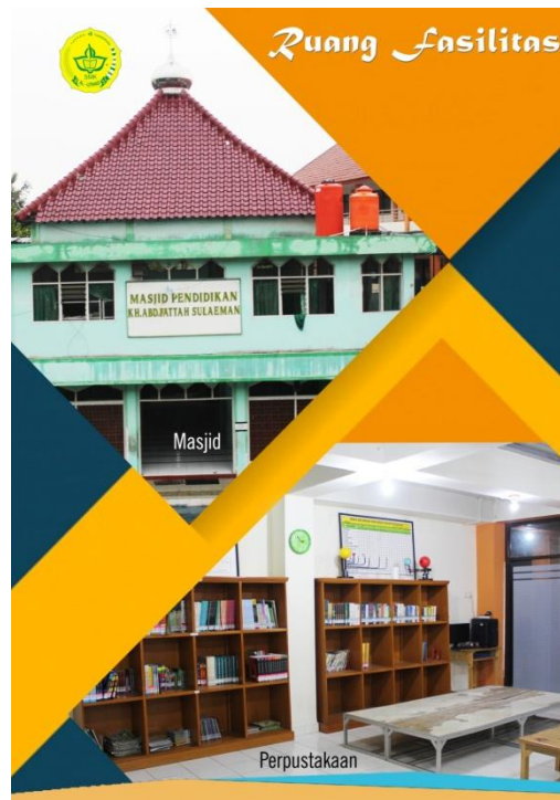
Gambar 10. Halaman 9

Desain dari Ruang Fasilitas SMK AL-ijthad Tangerang ini berisi Foto-Foto Masjid dan Perpustakaan. Desain ini berwarna Oren dan Hijau, font yang digunakan yaitu Calibri , Magneto