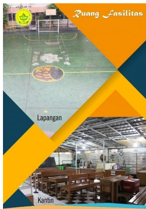
Gambar 9. Halaman 8