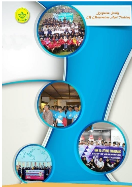
Gambar 16. Halaman 15

Desain dari Kegiatan Study Of Observation And Training ini berisi Foto-Foto Kegiatan Study Of Observation And Training. Warna Biru dan Putih, font Calibri, Magneto