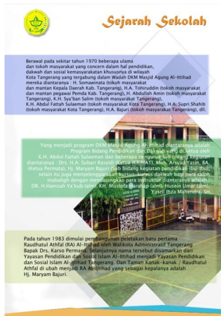
Gambar 6. Halaman 4

Desain dari Sejarah Singkat SMK AL-ijtihad Tangerang ini berisi gambar gedung SMK AL-ijtihad, dan Text Sejarah. warna putih dan hijau, font Calibri , Magneto