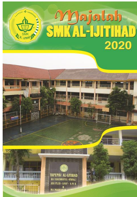
Gambar 2. Desain Halaman 1

Desain dari cover depan ini berisi Nama Sekolah, Text Travel , Text majalah dan SMK AL-Ijtitihad. Desain ini berwarna Hijau gradasi kuning emas, font yang digunakan yaitu Garde , Ceria Lebaran