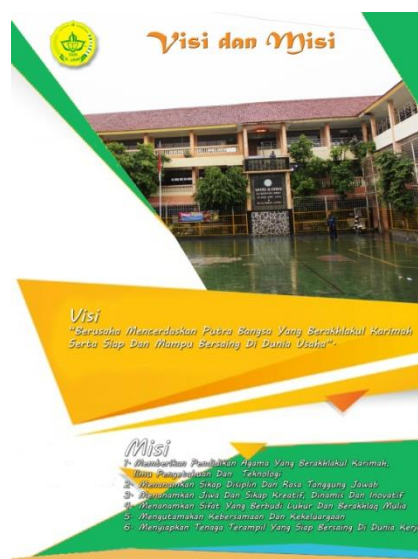
Gambar 7. Halaman 6