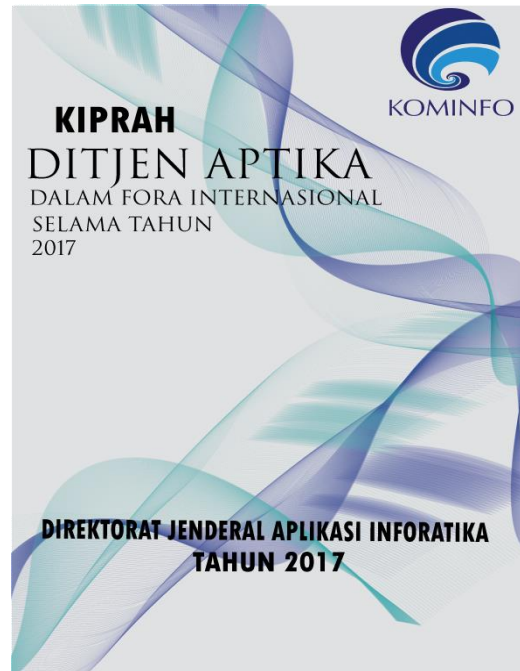
Gambar 3. Desain Cover Kiprah Aptika 2017.

Kiprah Aptika merupakan buku yang berisi laporan mensosialisasikan kegiatan dan program Ditjen Aptika dalam Fora Internasional selama satu tahun terakhir.