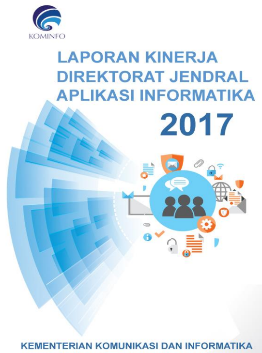
Gambar 1. Desain Cover Laporan Kinerja Aptika 2017

Laporan kinerja aptika berisikan tentang perbandingan tentang target kinerja dengan relasi masing-masing yang selanjutnya akan dianalisis lebih lanjut untuk diketahui apa kelebihan dan kekurangan dari sebuah kegiatan dan program yang diadakan Direktorat Jendral Aplikasi Informatika pada Kementerian Komunikasi dan Informatika Jakarta.