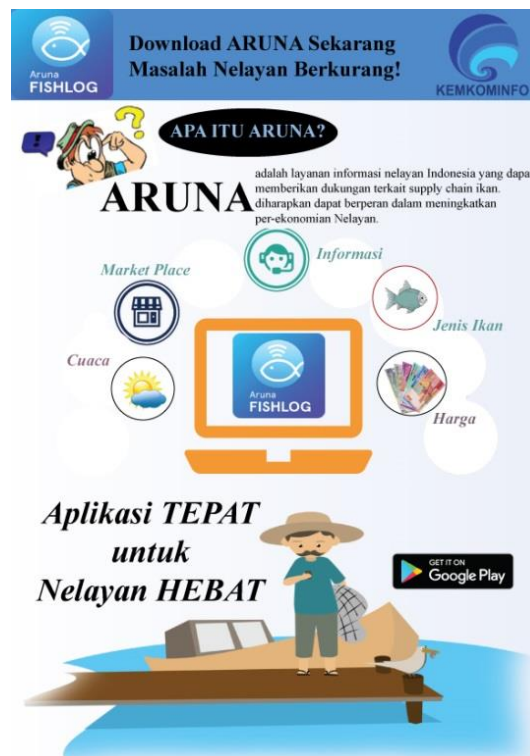
Gambar 5. Flyer aplikasi Aruna.

Flyer adalah media komunikasi visual yang biasa dibuat dengan ukuran relatif kecil dan terdiri hanya satu lembar. Menyiarkannya dilakukan dengan dibagi-bagikan. Desain yang akan ditampilkan terdiri dari : Info program aplikasi yang dibuat oleh Aptika, dan info simposium yang akan diadakan oleh Aptika.