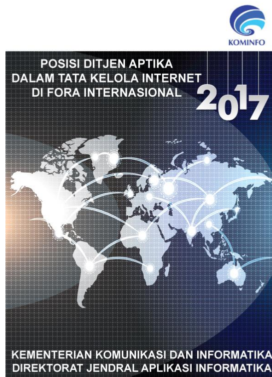
Gambar 4. Cover Disposisi Aptika 2017.

Kiprah Aptika merupakan buku yang berisi laporan mensosialisasikan kegiatan dan program Ditjen Aptika dalam Fora Internasional selama satu tahun terakhir.