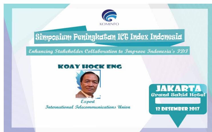
Gambar 6. Flyer untuk Simposium Ict Indonesia.

Aruna merupakan sebuah program yang baru diluncurkan oleh Aptika untuk memudahkan masyarakat terutama para nelayan agar dapat menjual hasil tangkapan laut mereka secara online dan secara tidak langsung dapat mengajarkan nelayan atau masyarakat lainnya agar melek akan teknologi yang sudah semakin canggih ini. Aplikasi Aruna dapat didownload secara gratis di displaystore ataupun appstore .