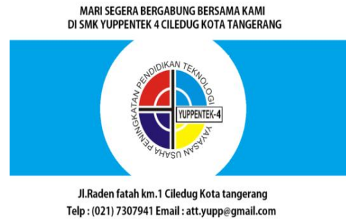
Gambar 23: Video Variasi title, logo dan alamat sekolah

Menggambarkan Logo dan alamat sekolah SMK Yuppentek 4