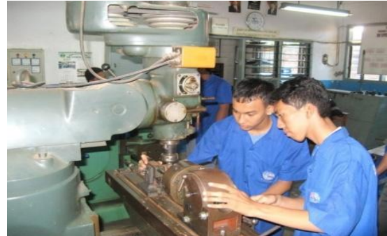
Gambar 11: Video Teknik pemesinan

Medium Shoot (MS) / INT Menggambarkan Jurusan Teknik Permesinan