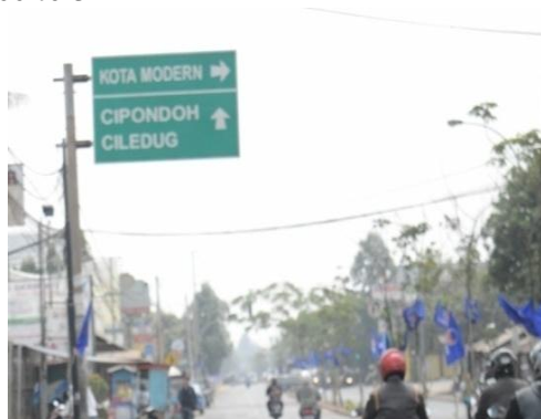
Gambar 5: Video Jalan menuju SMK Yuppentek 4 Ciledug Tangerang

Medium Long Shoot (MLS) / EXT Menggambarkan peta lokasi menuju SMK Yuppentek 4