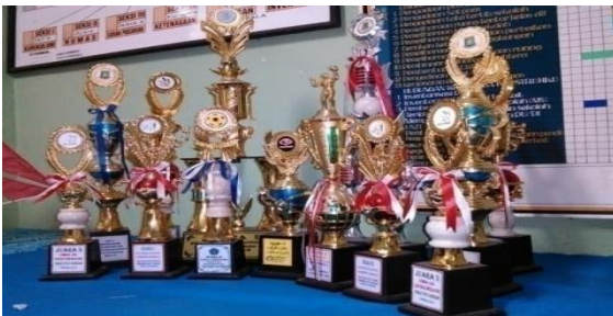
Gambar 9: Video Piagam prestasi SMK Yuppentek 4 Ciledug Tangerang

Full Shoot (FS) / INT Menggambarkan Piagam prestasi SMK Yuppentek 4 Ciledug Tangerang