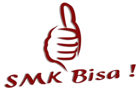
Siap Kerja, Cerdas dan Kompetitif Gambar 24: Video Logo SMK bisa