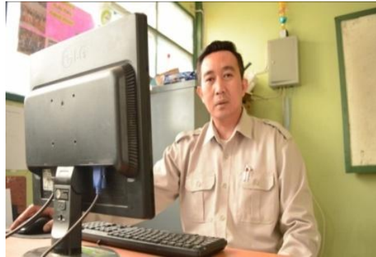
Gambar 18: Video Wawancara humas SMK Yuppentek 4 Ciledug Tangerang

Medium shoot (MS) / EXT Menggambarkan Wawancara Humas SMK Yuppentek 4