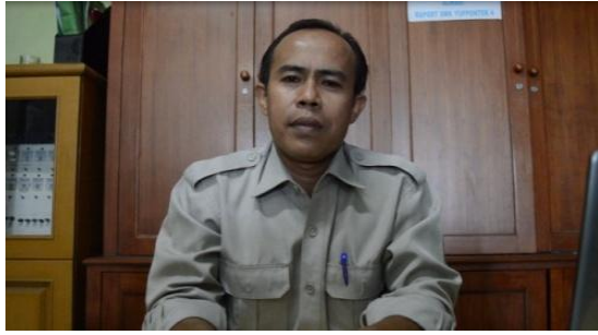
Gambar 8: Video Wawancara kepala sekolah

Medium close up (MCU) / INT Menggambarkan Wawancara Kepala Sekolah SMK Yuppentek 4