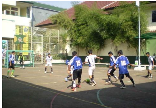
Gambar 19: Video Futsal SMK Yuppentek 4 Ciledug Tangerang

Medium shoot (MS) / EXT Menggambarkan Futsal SMK Yuppentek 4