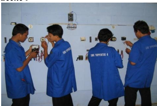
Gambar 10: Video Teknik instalasi tenaga listrik

Long medium (LM)/ INT Menggambarkan Jurusan Teknik instalasi tenaga listrik