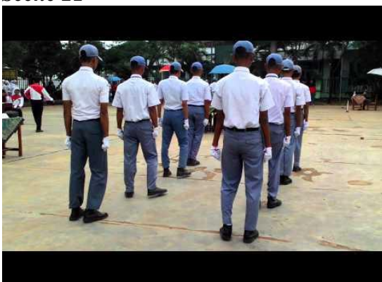
Gambar 22: Video Paskibra

Full Shoot (FS) / EXT Menggambarkan Paskibra SMK Yuppentek 4