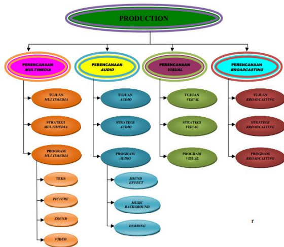
Gambar 25. Production

kesiapan crew dalam menjalankan perannya masing-masing dan kesiapan perlengkapan yang juga merupakan tanggung jawab masing-masing crew .