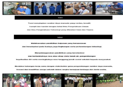
Gambar 8: Video Slide foto-foto kegiatan SMK Yuppentek 4 Ciledug Tangerang

Slide foto-foto kegiatan SMK Yuppentek 4 Ciledug Tangerang