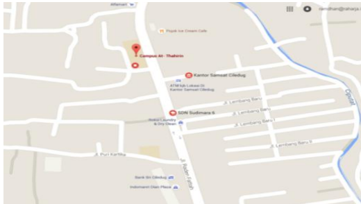
Gambar 4: Video Peta lokasi SMK yuppentek 4 Ciledug Tangerang

Bird Eye / EXT Menggambarkan peta lokasi menuju SMK Yuppentek 4