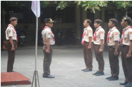
Gambar 21: Video Pramuka

Full Shoot (FS) / EXT Menggambarkan Pramuka SMK Yuppentek 4