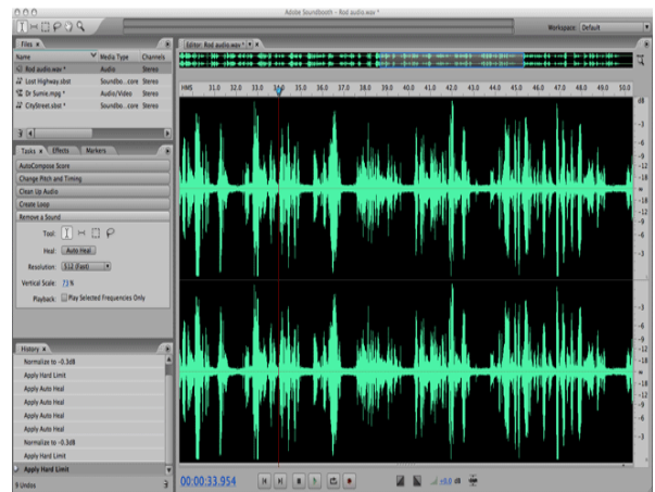
Gambar 25. Adobe Soundbooth

Setiap audio yang diterapkan untuk mengisi suara diambil dari video yang sudah dipersiapkan sesuai dengan kebutuhan dari media informasi yang dirancang, diambil dari musik mp3, dicari sound efek yang sesuai. Adanya program editing memudahkan untuk membuat audio kemudian dilakukan proses penyesuaian rancangan video yang akan disuguhkan kepada masyarakat.