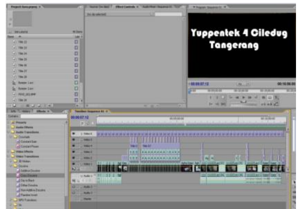
Gambar 26. Adobe Premiere Pro

Didalam proses produksi inilah perancangan spesial effects dibuat menggunakan aplikasi-aplikasi yang merupakan hasil dari kemajuan teknologi. Acuan storyboard diubah menjadi animatrix yaitu semacam slideshow dari storyboard yang sudah diisi dengan dialog yang belum diedit.