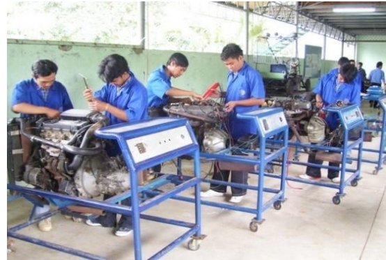
Gambar 12: Video teknik otomotif

Full Shoot (FS) / INT Menggambarkan Jurusan Teknik Otomotif