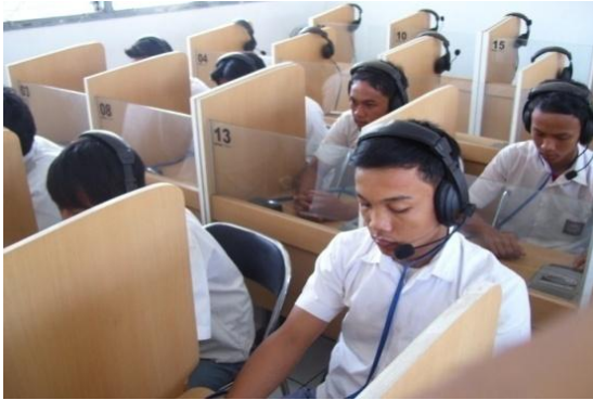
Gambar 14: Video Ruang laboratorium komputer

Medium Shoot (MS) / INT Menggambarkan Ruang Laboratorium Komputer SMK Yuppentek 4