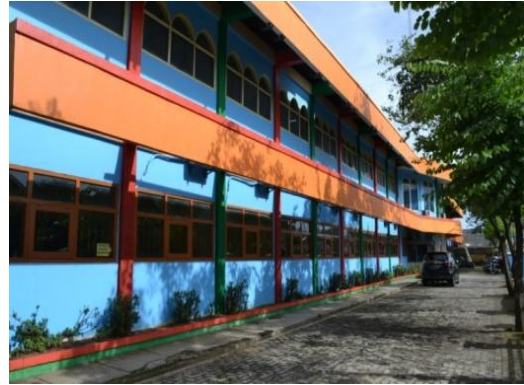
Gambar 6: Video keseluruhan gedung Sekolah

Full Shoot (FS) / EXT Menggambarkan Lingkungan sekolah