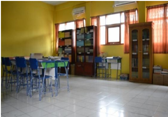
Gambar 15: Video Perpustakaan SMK Yuppentek 4 Ciledug Tangerang

Full Shoot (FS) / INT Menggambarkan Ruang Perpustakaan SMK Yuppentek 4