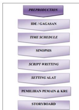
Gambar 1. Preproduction

Untuk Preproduction adalah step atau langkah dimana dimulainya ide, perencanaan dan persiapan dari Konsep Produksi MAVIB. Ada tujuh langkah Preproduction dalam Konsep Produksi MAVIB, dimulai dari Ide yang dituangkan secara sistematis, lalu diikuti dengan pembuatan sinopsis, Script Writing dan Storyboard . Dua tahapan terakhir adalah pemilihan pemain dan crew dan Setting Alat. Semua tahapan yang ada harus sesuai TimeSchedule yang ditetapkan. Untuk lebih jelasnya di ilustrasikan pada bagan berikut ini :