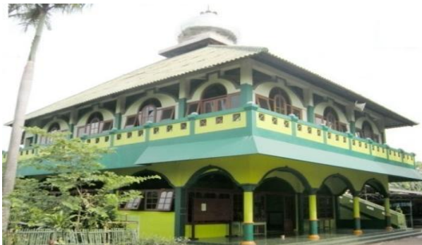
Gambar 16: Video Masjid SMK Yuppentek 4 Ciledug Tangerang

Full Shoot (FS) / EXT Menggambarkan Masjid SMK Yuppentek 4