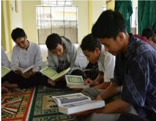
Gambar 20: Video Rohani Islam

Medium Shoot (MS)/ INT Menggambarkan Rohani Islam SMK Yuppentek 4