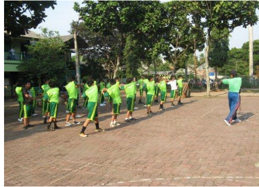
Gambar 17: Video Lapangan olahraga

Full Shoot (FS) / EXT Menggambarkan Lapangan SMK Yuppentek 4