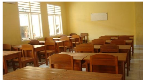
Gambar 13: Video Ruang kelas

Full shoot (FS) / INT Menggambarkan Ruang Kelas SMK Yuppentek 4