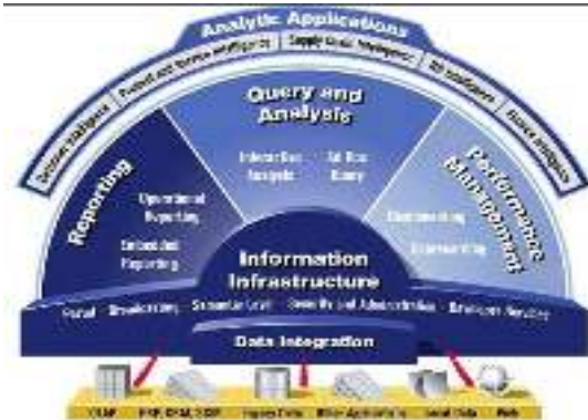
Gambar 2. Fungsi Business Intelligence

dalam bentuk pengetahuan. Business intelligence dapat melakukan analisa data dengan lebih efektif, contoh dalam menganalisa loyalitas pembeli sehingga meningkatkan keuntungan perusahaan atau bisnis yang sedang dijalankan.