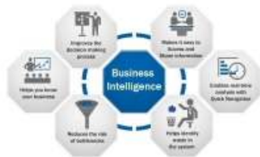
Gambar 4. Fungsi Business Intelligence

Sebagai pelengkap dalam penyampaian informasi, apakah penerima informasi masih perlu untuk menelusuri informasi tersebut, seperti slice and dice ? Apakah mereka butuh perhitungan berdasarkan informasi yang diperoleh ? Hal lain apa yang harus disediakan oleh business intelligence untuk mereka.