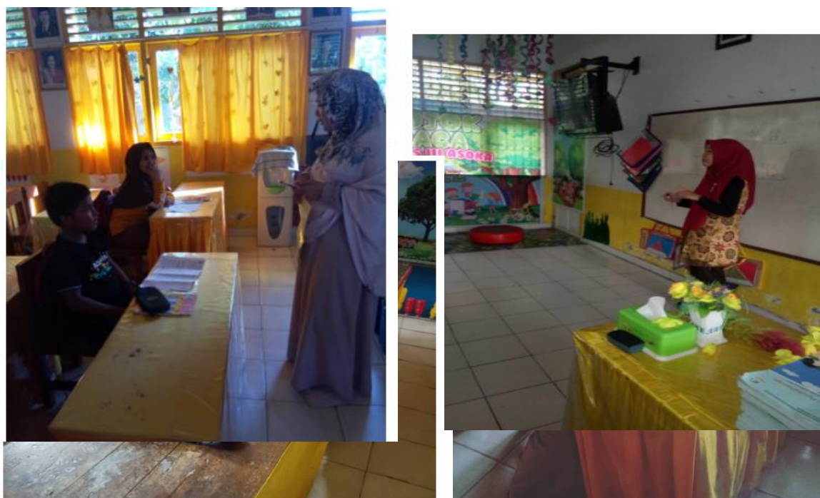
Gambar 3. Pelaksanaan kegiatan bimbingan dan pendampingan calon peserta KSN 2020

Pertemuan kedelapan (akhir kegiatan) dilakukan posttest untuk mengetahui seberapa jauh kemajuan peserta didik selama pemberian bimbingan belajar KSN-SD, Hasil posttest dibandingkan dengan hasil pretest yang diberikan di awal kegiatan (pertemuan pertama). Dengan demikian dapat diketahui sejauh mana peningkatan kemampuan peserta didik yang telah mengikuti bimbingan pra KSN-SD dalam menyelesaikan soal-soal KSN/OSN bidang IPA (sains).