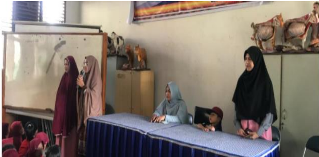
Gambar 2. Acara pembukaan kegiatan bimbingan belajar bagi calon peserta KSN 2020

Pertemuan kedua, dilaksanakan pretest sebagai uji kemampuan awal peserta bimbingan. Hal ini dimaksudkan untuk mengetahui sejauh mana tingkat pemahaman peserta dalam menyelesaikan soal OSN/KSN-SD, sehingga nantinya memudahkan narasumber/tutor dalam pembahasan materi KSN dan menyiapkan strategi bimbingan belajar yang akan diberikan.