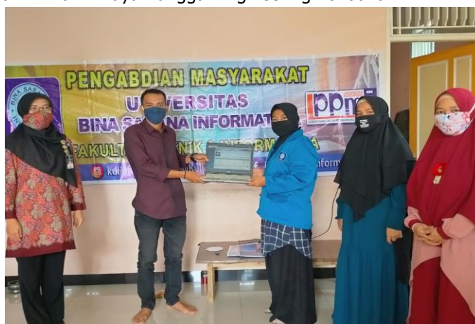
Gambar 3. Pelaksanaan Hibah (Serah Terima Aplikasi) Sistem Informasi Akuntansi Penerimaan Tagihan Utang (SIAPTAU)