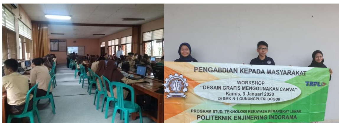
Gambar 2. Pelaksanaan Kegiatan PkM

Secara umum kegiatan pengabdian ini berjalan lancar, dimulai dari kegiatan survey pendahuluan, pelaksanaan kegiatan pegabdian, sampai kepada penyusunan laporan. Berdasarkan diskusi yang diselenggarakan diperoleh kesimpulan bahwa para peserta pengabdian tersebut merasa senang dan puas. Hal ini terbukti dengan adanya permintaan dari para peserta agar kegiatan pengabdian ini tidak hanya diselenggarakan satu kali tetap harus berkelanjutan. Melalui pengabdian yang berkelanjutan akan terjalin hubungan kerjasama antara Politeknik Enjinereng Indorama dengan SMKN 1 Gunung Putri Bogor. Hubungan kerjasama dalam hal pengembangan desain grafis untuk siswa/I SMKN 1 Gunung Putri Bogor sehingga program pengabdian masyarakat dapat berjalan maksimal, yang menjadi salah satu kewajiban civitas akademika Politeknik Enjinereng Indorama.