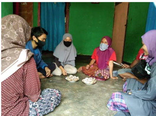
Gambar 2. Pelatihan Ibu-ibu PKH