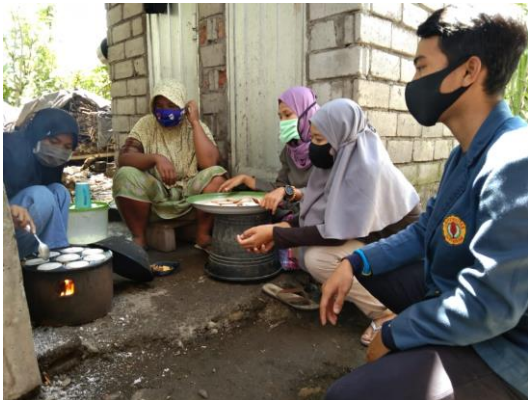
Gambar 1. Pelatihan Ibu-ibu PKH