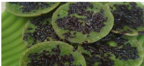
Gambar 4. Produk Serial (Serabi Milenial)

Analisis hasil pelaksanaan kegiatan P1000WB KKN New Normal 2020 antara lain: