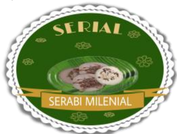
Gambar 3. Logo Produk

Nama produk serabi yang dibuat ialah Serial (Serabi Milenial). Alasan pemilihan nama ini karena sesuai dengan selera makanan generasi milenial. Generasi milenial sekarang kurang menyukai kuliner lokal seperti halnya kue serabi biasa. Oleh karena itu, inovasi ini bisa menambah minat generasi milenial untuk mencintai produk lokal. Pada bagian logo dicantumkan nama produk serial dan gambar produk. Sedangkan piring pada logo produk menggambarkan tentang kemasan yang identik waste zero .