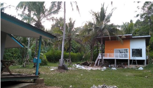
Gambar 3. Perubahan penggunaan lahan dari agroforestri menjadi vila (Vila La Nadya).