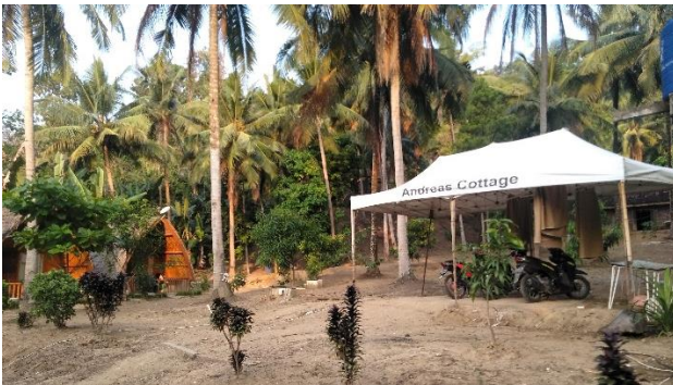
Gambar 2. Perubahan penggunaan lahan dari agroforestri menjadi vila (Vila Andreas).

Pembangunan drastis di Pulau Pahawang ialah tanah milik seorang eksekutif di Provinsi Lampung. Lahan milik eksekutif ini mencapai \pm 10\% dari seluruh total luas lahan di Pulau Pahawang. Lahan ini mencakup tambak, vila, mangrove serta agroforestri. Terjadi perubahan pola tanam yang dilakukan di lahan milik eksekutif ini dengan mengubah agroforestri menjadi kebun ( Hylocereus polyhizus .) sejak tahun 2008. Selain lahan milik eksekutif yang membuka lahan untuk kebun naga, sebagian warga juga melakukan pergantian pola tanam agroforestri dengan kebun pisang (Gambar 4). Sesuai dengan Pratama et al, (2015) pola tanam monokultur identik dengan adanya aktivitas pembukaan lahan. Pergantian pola tanam ini akan berdampak pada aspek ekologis yang dimiliki agroforestri di Pulau Pahawang.