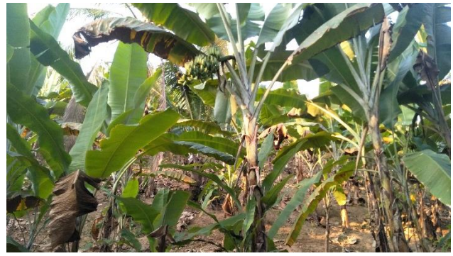
Gambar 4. Pembukaan lahan agroforestri untuk kebun pisang ( Musa sp. ).

Tekanan akan kebutuhan lahan agroforestri yang tinggi membuat masyarakat mengambil keputusan untuk membuka lahan hutan primer yang berbatasan dengan agroforestri untuk mengganti pola tanam atau menanam tanaman semusim. Komposisi jenis tanaman yang ditemukan dalam agroforestri terdiri atas 11 jenis pohon dan 13 jenis bukan pohon, jenis-jenis tanaman tersebut terdiri dari sayur-sayuran, buah-buahan, umbi-umbian, biji-bijian dan tanaman berkayu. Tanaman pohon yang sering dijumpai pada lahan agroforestri di Pulau Pahawang adalah jenis bayur ( Pterospermum javanicum ), waru gunung ( Hibiscus similis ), jengkol ( Pithecellobium lobatum ), dan petai ( Parkia speciosa ). Jenis tanaman bukan pohon yang sering dijumpai pada lahan agroforestri antara lain gadung ( Dioscorea hispida ), pisang ( Musa sp ), kelapa ( Cocos nucifera ) dan cengkeh ( Eugenia aromatic ). Keunikan yang dimiliki lahan agroforestri di Pulau Pahawang menurut Puspasari et al. (2018) harus dapat dioptimalkan produktivitas lahan dengan seberapa banyak variasi komposisi jenis dalam satu lahan dan sistem pengelolaan.