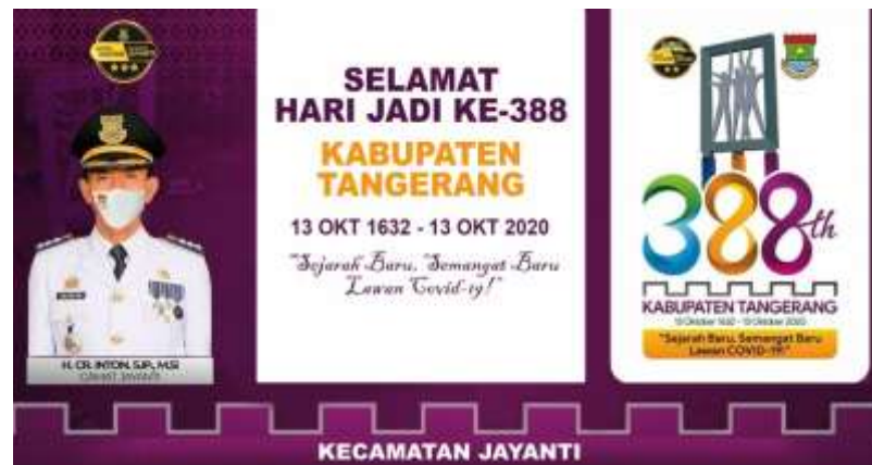
Gambar 11. Spanduk HUT Kab. Tangerang

Pada gambar 11 ini merupakan spanduk yang berisi ucapan selamat hari jadi perwakilan dari kecamatan jayanti kepada kabupaten tangerang sebagai bentuk apresiasi dan dukungan kepada pemerintahan pusat daerah.