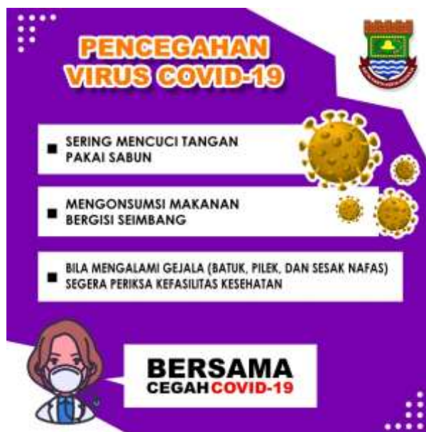
Gambar 14. Spanduk Pencegahan Virus Covid-19

Pada gambar 14 diatas merupakan spanduk sebagai bentuk kepedulian kepada masyarakat agar selalu menjaga kesehatan agar terhindar dari virus Covid-19 dan mengarahkan masyarakat apabila mengalami gejala.