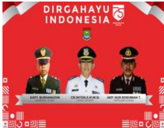
Gambar 9. Desain spanduk sebagai penyampaian informasi mengenai HUT RI dan Kabupaten.

Pada gambar 9 merupakan spanduk berukuran 2x2 meter dengan menampilkan foto Camat, Danramil dan Kapolsek Kec. Jayanti.