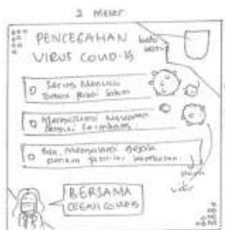
Gambar 6. layout kasar pada spanduk pencegahan virus Covid-19

Pada gambar 6 spanduk pencegahan berukuran 2x2 meter, didalamnya terdapat mengajak masyarakat untuk melakukan pencegahan agar terhindar dari virus Covid-19.