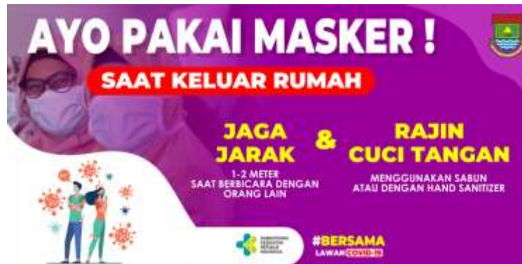
Gambar 13. Spanduk Himbauan Ayo Pakai Masker!

Pada gambar 13 merupakan spanduk himbauan kepada masyarakat agar selalu menjalankan 3M yaitu memakai masker, menjaga jarak dan selalu mencuci tangan menggunakan sabun.