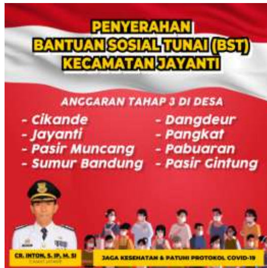
Gambar 10. Spanduk Bantuan Sosial Tunai (BST)

Pada gambar 10 ini merupakan daftar desa-desa yang berhak mendapatkan Bantuan sosial tunai selama masa pandemic dengan spanduk yang berukuran 3x3 meter yang di lengkapi dengan foto Camat Jayanti.