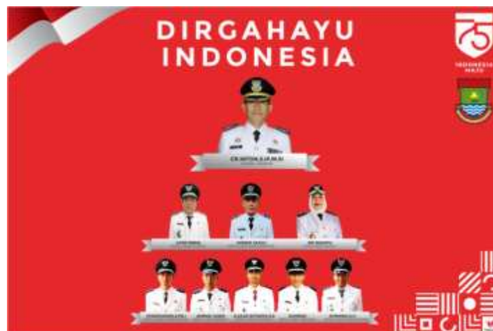
Gambar 12. Spanduk HUT RI (Camat dan Kades)

Pada gambar 12 adalah spanduk peringatan HUT RI dengan menampilkan camat dan seluruh Kepala Desa yang ada di kecamatan Jayanti dengan tema merah putih sebagai warna kesatuan.