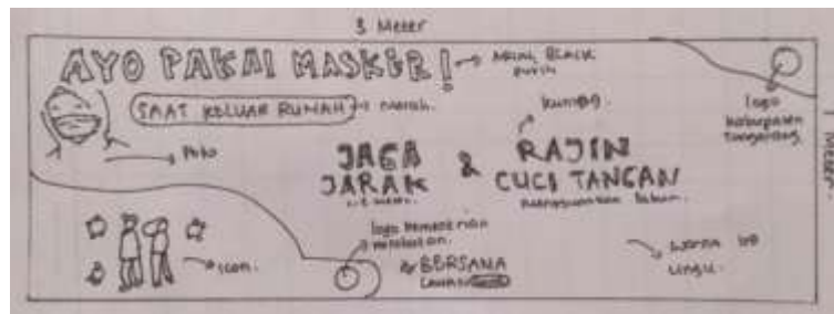
Gambar 5. layout kasar pada spanduk himbauan Ayo pakai masker!

Pada gambar 5 spanduk himbauan berukuran 3x1 meter, terdapat tulisan untuk peringatan kepada seluruh masyarakat agar selalu menggunakan masker, jaga jarak dan tidak lupa untuk mencuci tangan.