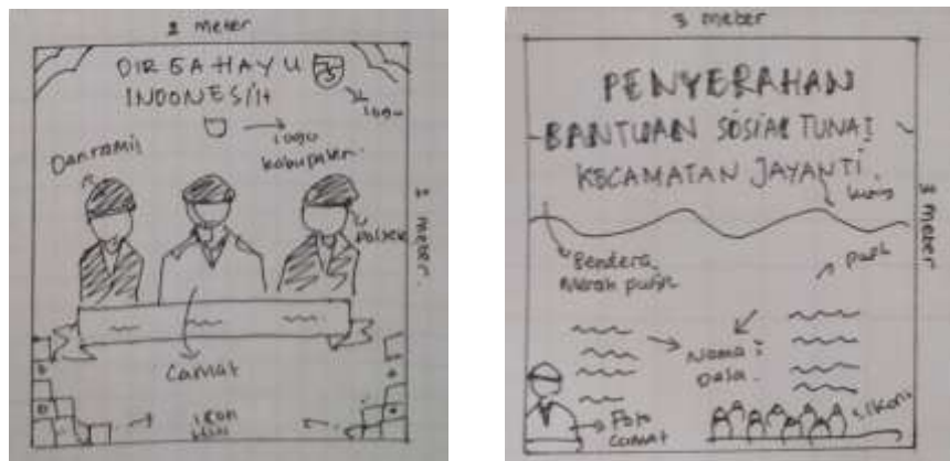
Gambar 1 dan 2 layout kasar pada spanduk hut ri dan bantuan sosial tunai.

Pada gambar 1 spanduk hut ri berukuran 2x2 meter, didalam nya ada gambar camat, danramil dan kapolsek untuk memberi informasi pada masyarakat. Pada gambar 2 spanduk bantuan sosial tunai berukuran 3x3 meter, pada gambar tersebut berupa informasi lebih lanjut daerah mana saja yang mendapatkan BST tersebut.