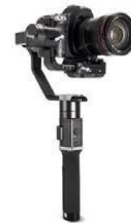
Gambar 7. DSLR Camera Gimbal