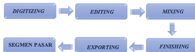
Gambar 8. Post-Production

Post-production atau Pasca Produksi merupakan langkah akhir dari penyelesaian sebuah karya yang dimana berawal dari karya mentah menjadi sebuah video yang utuh dan sempurna dan mampu menceritakan pesan dan informasi di dalamnya dengan menarik para audience. Di dalam proses post-production diperlukannya beberapa tahapan seperti Digitizing , Editing , Mixing , Finishing , Exporting , dan Segmen pasar.