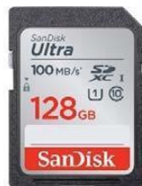
Gambar 6. Sd Card Sandisk SDHC 128GB Ultra 100Mb/s Stabilizer