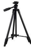
Gambar 3. Tripod