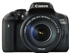
Gambar 4. Camera Canon 750D