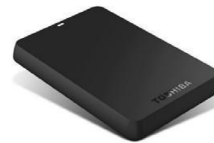
Gambar 5. Hard Disk 1 TB