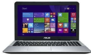
Gambar 2. Intel Core i7-5500U CPU

Perancangan video ini menggunakan beberapa peralatan pendukung, diantaranya Intel Core i7-5500U CPU , Camera 750D , Tripod , Hardisk 1 TB , dan SdCard . Perancangan ini mengambil gambar di dalam maupun di luar ruangan.