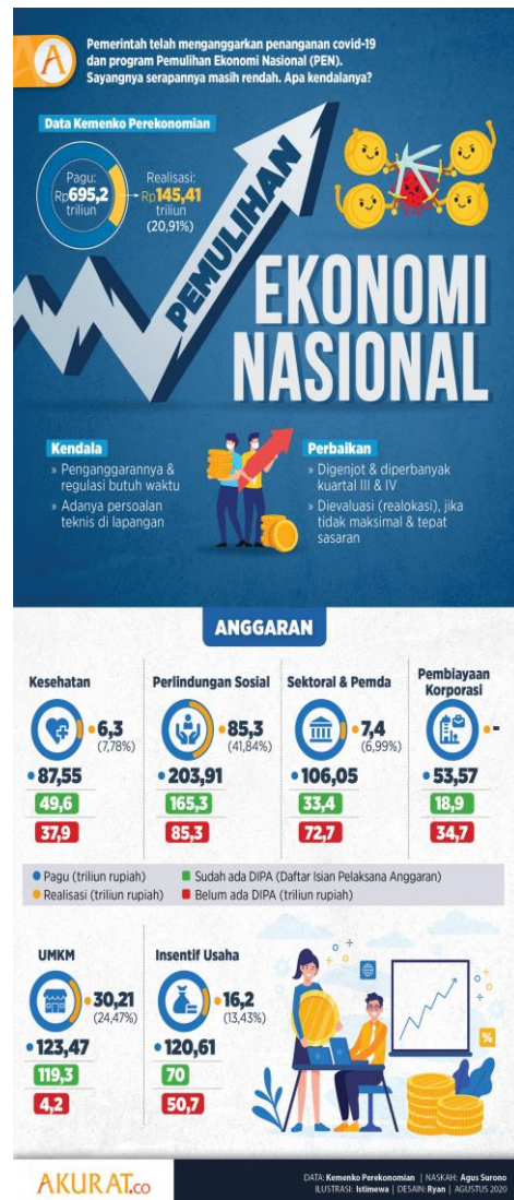
Gambar 1 Program Pemulihan Ekonomi

Mengacu pada program PEN dengan pemberian insentif usaha berupa keringan pajak, Seperti diketahui, sejak 2018 pengusaha Usaha Mikro, Kecil dan menengah (UMKM) telah dipungut pajak penghasilan final sebesar 0,5 persen. Insentif pajak UMKM ini ini tertuang dalam Peraturan Pemerintah (PP) Nomor 23/2018 tentang Pajak Penghasilan atas Penghasilan dari Usaha yang Diterima atau Diperoleh Wajib Pajak yang Memiliki Peredaran Bruto Tertentu (Dibawah 4.8Milyar per tahun), maksudnya agar kelompok UMKM tetap dikenakan kewajiban membayar Pajak Penghasilan (PPh) yang didasarkan pada