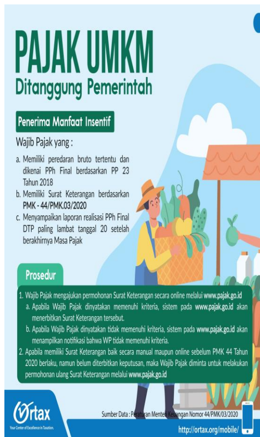
Gambar 3 Insentif Pajak

Sementara itu Pph UMKM Ditanggung Pemerintah adalah Pemerintah menanggung PPh Final yang seharusnya dibayarkan oleh pelaku usaha UMKM yang peredaran brutonya dibawah 4,8 miliar rupiah per tahun. Kebijakan pemberian insentif pajak penghasilan (PPh) final ditanggung pemerintah (DTP) bagi Usaha Mikro Kecil & Menengah (UMKM) yang awalnya sampai 30 September ini diperpanjang sampai Desember 2020. Informasi yang diperoleh dari catatan otoritas pajak, saat ini baru ada 201.000 usaha mikro, kecil, dan menengah (UMKM) yang memanfaatkan insentif Pajak Penghasilan (PPh) final ditanggung pemerintah, kemungkinan pelaku UMKM masih belum memahami kebijakan insentif pajak ini karena jumlah wajib pajak UMKM yang tercatat membayar PPh final pada 2019 sebanyak 2,3 juta pelaku usaha, jadi dengan jumlah yang masih terbatas ini bisa dikatakan belum banyak UMKM yang memanfaatkan insentif pajak ini. Pemerintah