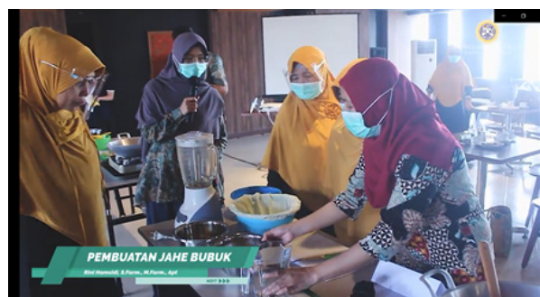
Gambar 2. Cara pembuatan jamu instan jahe

Pelatihan dan pendampingan yang dilaksanakan berjalan dengan baik atas kerjasama dengan mitra yang sangat antusias mengikuti serangkaian acara dalam program ini. Dalam pelatihan dan pendampingan kepada mitra tidak mengalami kendala karena teknologi yang digunakan sangat sederhana dalam pembuatan sediaan jamu instan dan hand sanitizer alami. Demo pembuatan sediaan jamu dilakukan oleh tim pelaksana pengabdian masyarakat dengan video zoom sehingga bisa disaksikan oleh peserta secara online (Gambar 2). Peserta dibekali dengan booklet cara pembuatan jamu yang dapat langsung dicobakan dengan mudah dan cepat di rumah. Booklet tiap peserta berisi ramuan jamu beras kencur, kunir asam, wedang jahe madu, wedang pokok, dan wedang uwuh. Bahan-bahan yang digunakan pada saat pelatihan yaitu, jahe, kencur, pala, cengkeh, kayu manis, temulawak, kapulaga, secang, dan daun pandan.