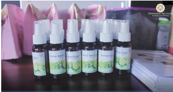
Gambar 3. Produk hand sanitizer

ekstrak daun sirih jika disimpan rapat di kulkas bisa bertahan satu bulan. Kalau langsung digunakan dan terpapar udara, hanya bertahan tiga hari.