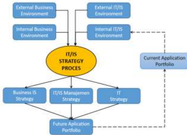
Gambar 1. Metode Ward And Peppard

saat ini baik terhadap lingkungan bisnis internal dan lingkungan bisnis eksternal.