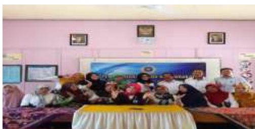
Gambar 1. Bersama dengan Bapak/Ibu Guru SDN di Handil Bakti