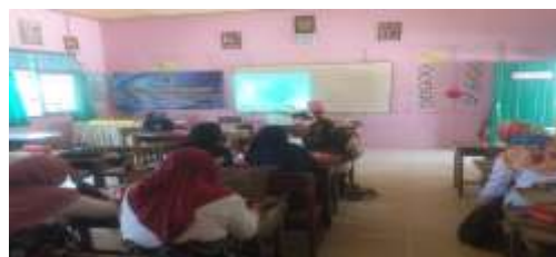
Gambar 6. Mereview Hasil Unjuk Kerja yang dilakukan oleh Peserta