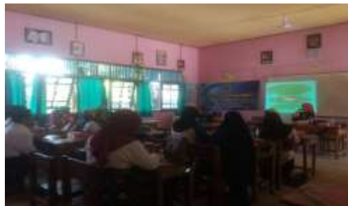
Gambar 3. Peserta Menyimak Materi yang disampaikan oleh Narasumber