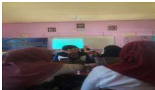
Gambar 4. Sesi Tanya Jawab