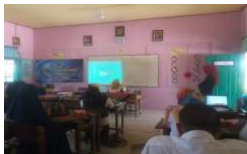
Gambar 5. Latihan dalam Menganalisa Data Penelitian (Desain Eksperimental) oleh Peserta